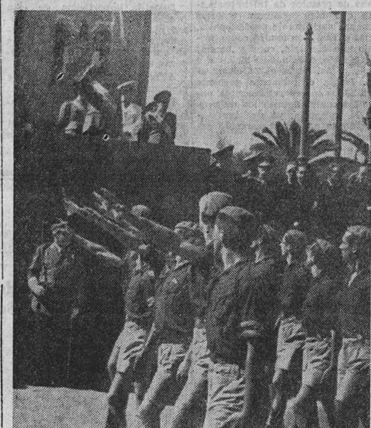
El Frente de Juventudes desfila ante el Caudillo