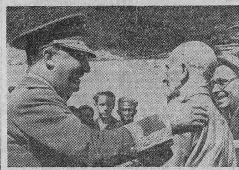
El Caudillo saluda cariñosamente a un veterano carlista