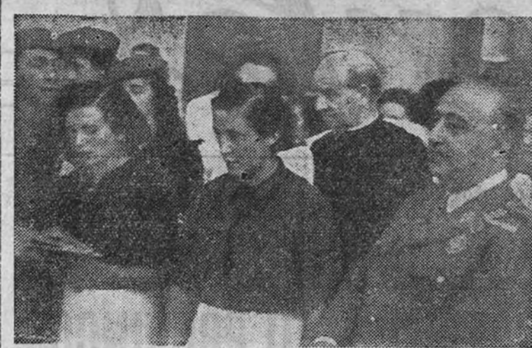
El Caudillo, con la Delegada Nacional de la Sección Femenina, durante su visita al Albergue femenino de Deva