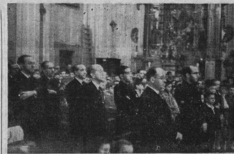
Jerarquías del S. E. M. y del Magisterio primario presiden la solemneidad celebrada en la iglesia del Sacramento.

«Usted es un poco romántica, soñadora, como la Revista para la mujer «X». Un mucho elegante, como la Revista para la mujer «Y».