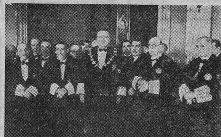
El Ministro de Justicia, con otras ilustres personalidades, en el acto de la apertura de Tribunales.

A mediodía de ayer, en el Palacio de Justicia, se celebró el solemne acto de apertura del año judicial 1943-44, desarrollando el discurso inaugural el Ministro de Justicia, don Eduardo Aunós. Mucho antes de las doce de la mañana, hora señalada para la sesión, las dependencias inmediatas al salón del Tribunal Supremo se encontraban totalmente ocupadas por magistrados y representantes judiciales, en espera de la llegada del Ministro. A éste acompañaban el Subsecretario del Departamento, señor Gómez Gil; subdirector general de Justicia, señor Soler, y Delegado Nacional de Justicia y derecho, señor Gistáu.