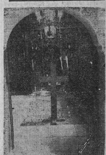
En una capilla del Monasterio Nacional de Rila, descansará eternamente Boris III

nas de la Biblia en todos los muros y bóvedas de la nave. Durante los pasados días miles de coronas de todo el pueblo búlgaro ocuparon la enorme Iglesia de San Alejandro Nevsky. Hoy, en la imposibilidad de que permanecieran todas, han sido retiradas. Pero quedan aún las coronas enviadas por los Soberanos y Jefes de Estado.