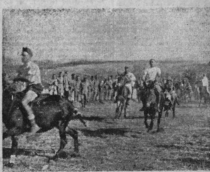
La salida de las carreras de mulos celebradas por las tropas canadienses en su campamento en Sicilia