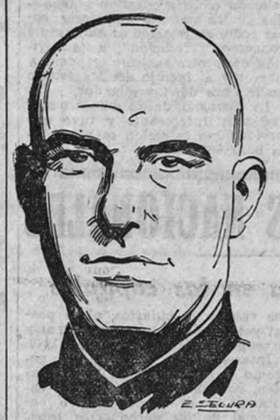
El teniente general Renato Ricci ha sido designado por el Duce, por medio de su "Orden del día número 6", jefe de la Milicia Voluntaria para la seguridad nacional

Nuevo jefe de la Milicia Voluntaria italiana