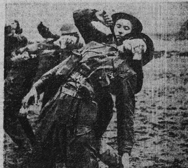
En un campo de entrenamiento los futuros "commandos" aprenden a utilizar el cuchillo para posibles ataques por sorpresa.