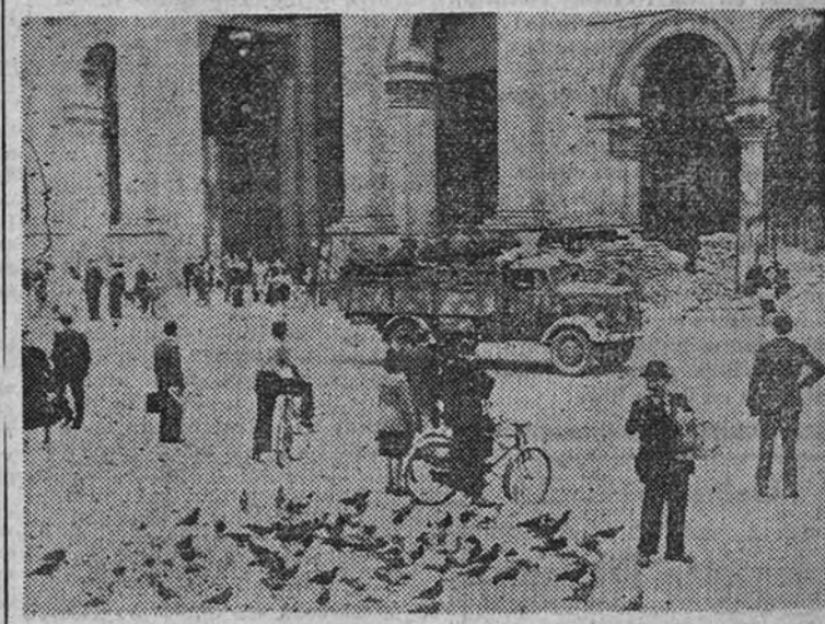
Un camión ocupa la plaza por tropas alemanas a su llegada a la plaza de la catedral, en Milán, en la mañana del día 11