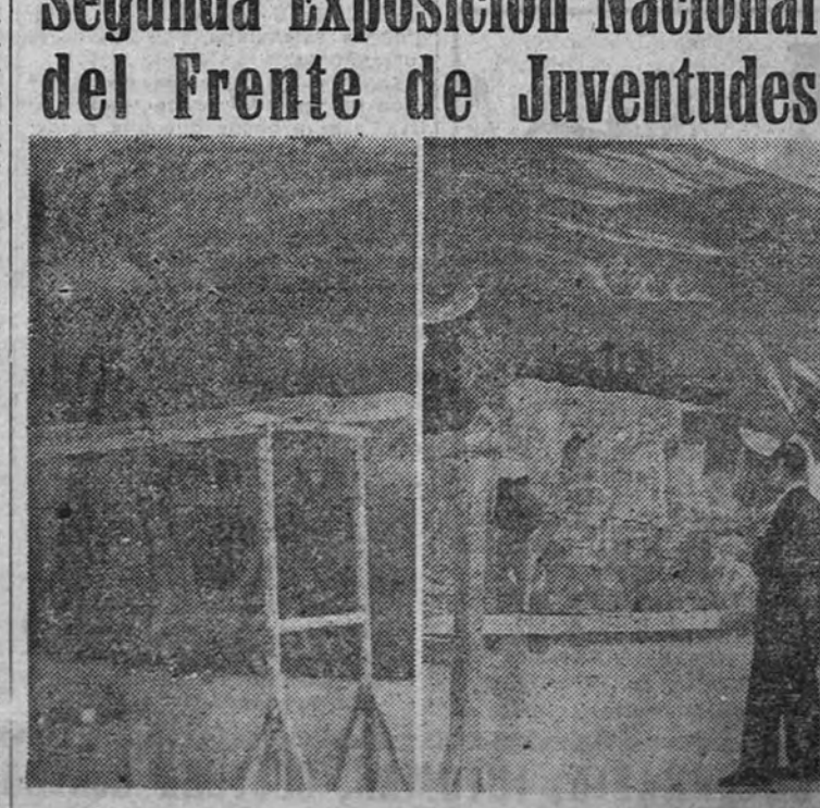
En el Palacio de Bibliotecas y Museos va a ser inaugurada próxima- mente la II Exposición Nacional del Frente de Juventudes. Un artista, decorando las salas en que será instalada la Exposición, con motivo allegóricos