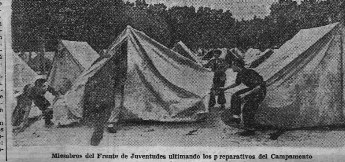
Miembros del Frente de Juventudes ultimando los preparativos del Campamento

Restablecimiento del culto en la Rusia ocupada