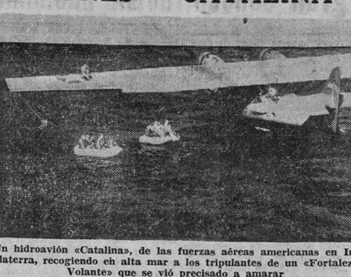
Un hidroavión «Catalina», de las fuerzas aéreas americanas en Inglaterra, recogiendo en alta mar a los tripulantes de un «Fortaleza» que se vio precisado a amarrar