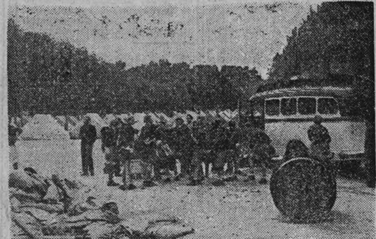
Un contingente de camaradas del Frente de Juventudes, a su llegada al Retiro, donde acamparán

Estos trabajos son principalmente de pintura, escultura, aeromodelismo, artesanía y gran cantidad de trabajos hechos por los