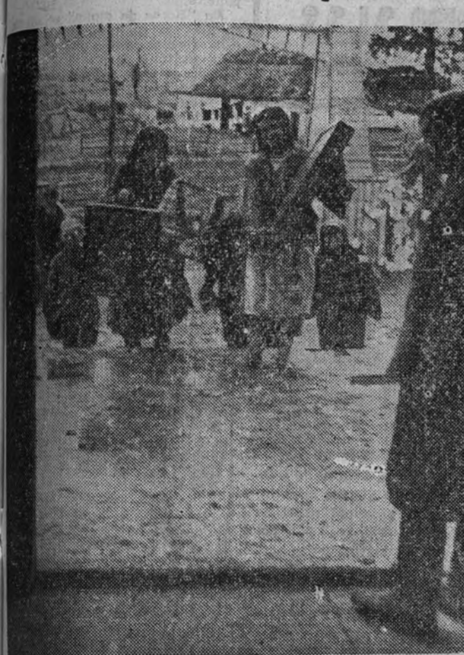
En las regiones ocupadas de Rusia se restablece el culto. A las viejas iglesias acuden los campesinos con los viejos iconos, escondidos durante largo tiempo, para, después de bendecirlos, volver a colocarlos en el lugar de honor de la vivienda

Restablecimiento del culto en la Rusia ocupada