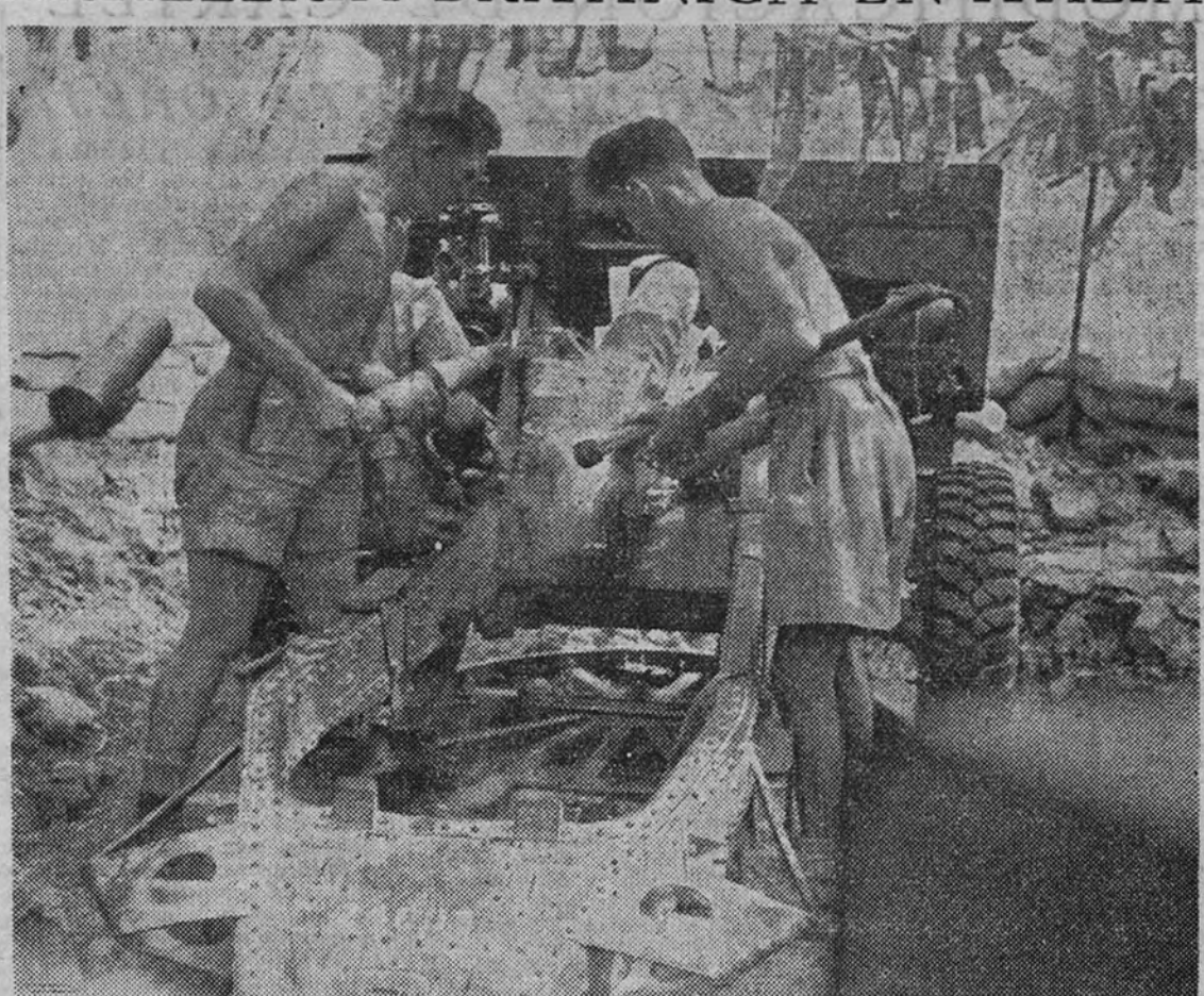
Artillería del octavo Ejército británico haciendo fuego en las operaciones que se desarrollan en el frente italiano

Existen verdaderas razones de inquietud en cuanto a la situación alimenticia de la India