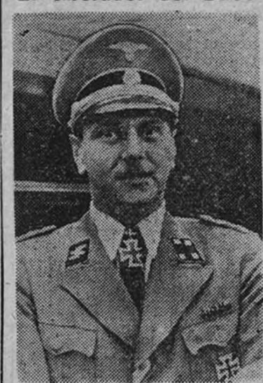
El capitán Otto Skorzeny, que después de haber llevado a cabo la difícil empresa, fue condecorado por el Führer con la Cruz de Caballero de la Cruz de Hierro

También lo es, espera todos los meses con verdadero interés la aparición de su Revista: la aparición de «X».