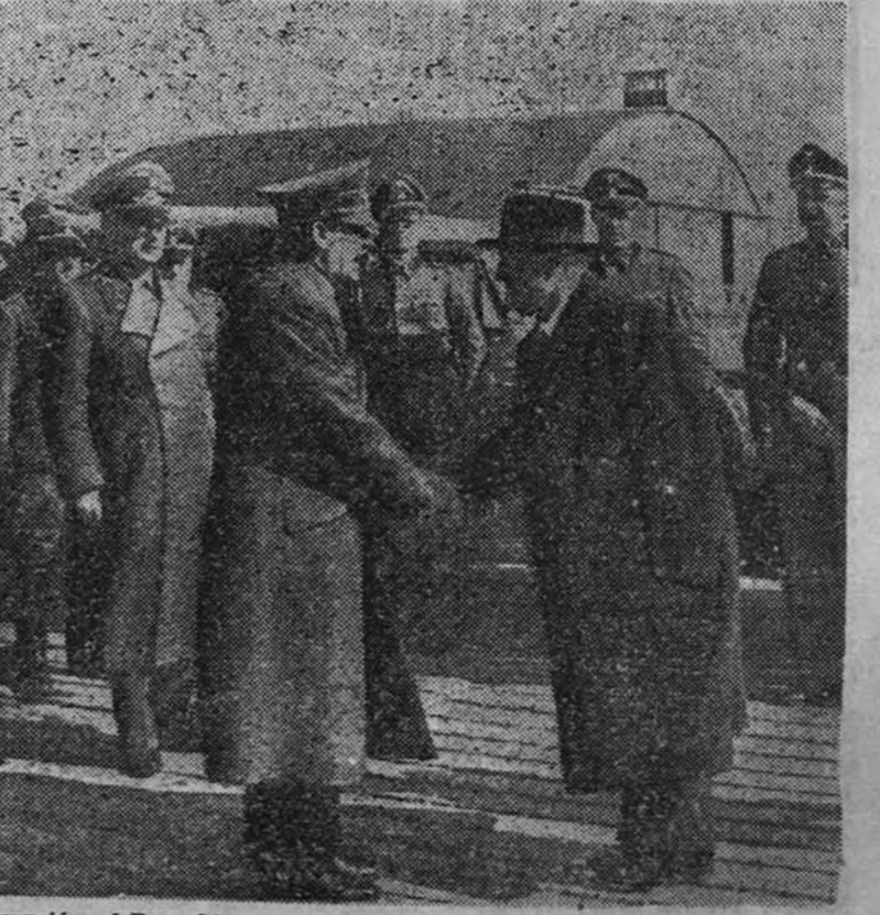
Inmediatamente después de su liberación, el Duce hizo una visita de varios días al Führer. Mussolini saluda a Hitler