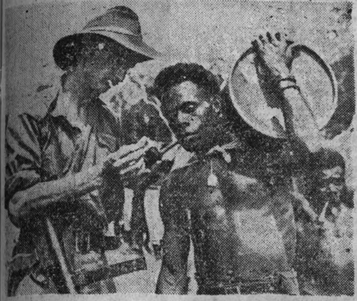
Un indigena de Nueva Guinea recibe fue- go de un soldado australiano. Muchos nativos son empleados por las tropas australianas para llevar suministros a los puestos avanzados de la jungla, que ellos conocen muy bien.