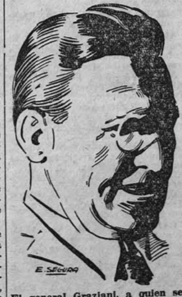
El general Graziani, a quien según anuncian las crónicas de Berlín, ha nombrado Mussolini ministro de Defensa Nacional, en su nuevo Gobierno