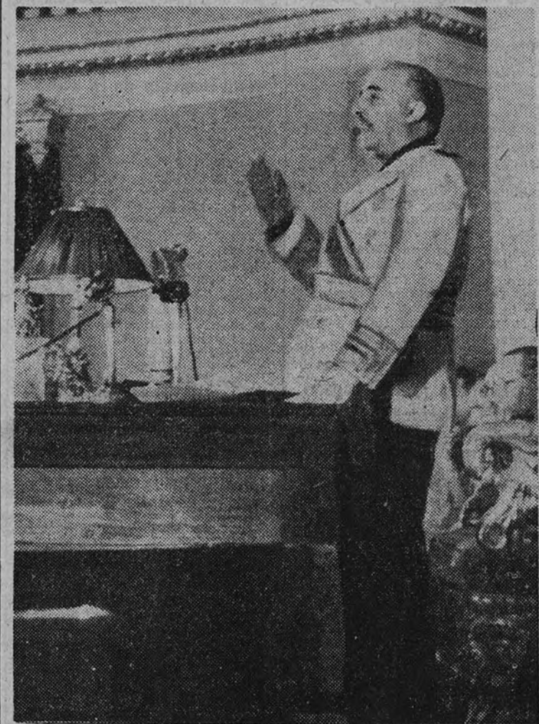
Su Excelencia el Jefe del Estado pronunciando su importante discurso ante el Consejo Nacional

En un importante discurso, el Caudillo encomienda al Consejo Nacional de la Falange el estudio de las medidas para elevar y redimir a nuestro campo