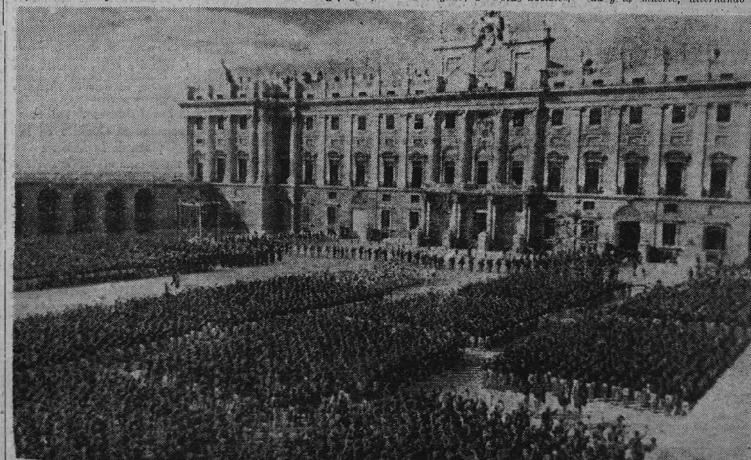
Magnífico aspecto de la plaza de la Armería durante la concentración de las Falanges Juveniles de Franco

Cuando el sol se hundía tras las líneas rectas del Palacio de Oriente y tras las representaciones de la Vieja Guardia, de la División Azul y de los distritos, iniciaba su desfile el Frente de Juventudes, había ya en el ambiente un claro sentido de seguridad y de plenitud lograda. Ellos se acercaban sencillos y solemnes, con su paso firme y sus filas agrupadas en la rectitud y el bloque de la formación, alzando al aire las canciones y elevando los brazos desnudos y llenos de músculos, (Continúa en cuarta página.)