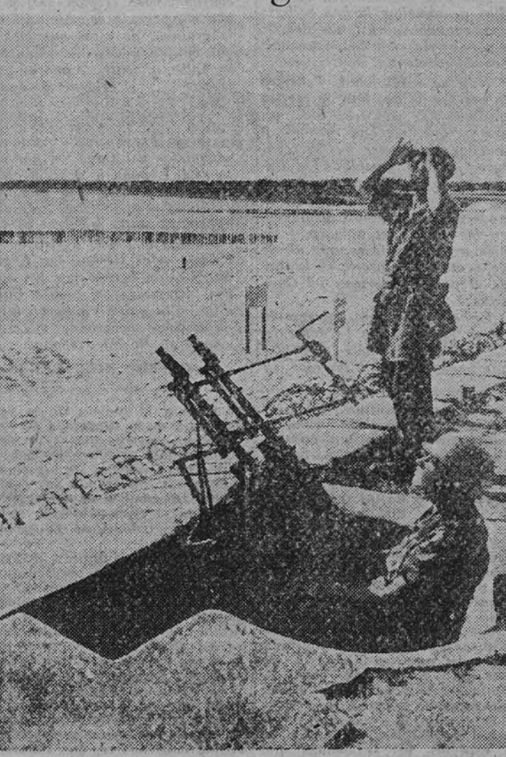
Un puesto de ametralladora en un paseo de una playa de la costa del Canal coloca su arma en posición de fuego ante el anuncio de la presencia de aviones enemigos