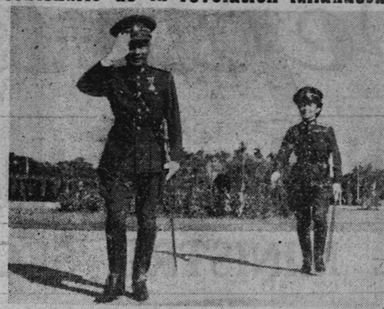
Tailandia celebra el aniversario de su Revolución. En la foto aparece el primer ministro, P. Phibun Songkhram, habiéndose condecorado de este próspero país, acompañado de su esposa.