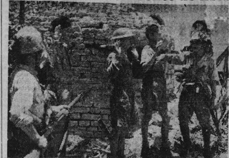
Soldados japoneses detienen a un destacamento enemigo hecho prisionero