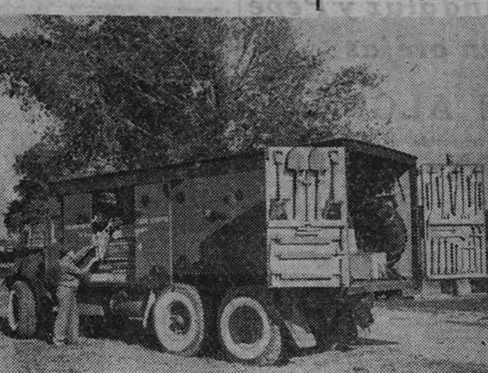
Uno de los camiones utilizados por los aliados en Italia. Este camión lleva las herramientas precisas para arreglar los defectos en vías y locomotoras