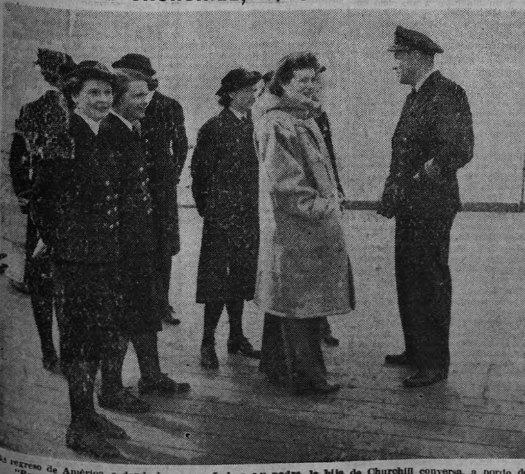
La hija de Churchill, con un oficial y algunas de las muchachas inglesas que prestan servicio en la Marina