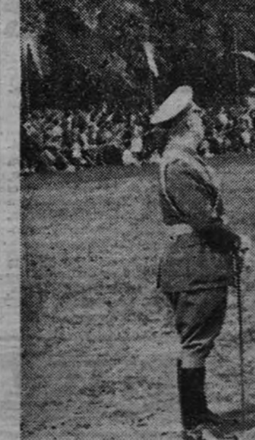
Un momento de la entrega de los despachos

Se encontraban en el Campo del Polo el Gobernador Civil de Segovia, Gobernador Militar de la misma provincia y Jefe Provincial del Movimiento.