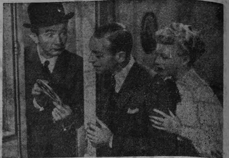
Hoy presenta el Palacio de la Música su segundo estreno de la temporada: "Historia de Irene Case", con Fred Astaire y Ginger Rogers, que en este film confirman su fama de bailarines y actores.