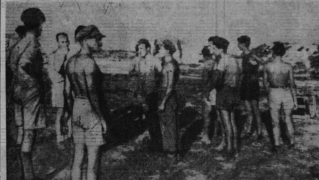
Soldados ingleses ocuparon recientemente la isla de Kos, en el Dodecaneso, isla que, según las últimas noticias, ha sido conquistada por los alemanes.

BERLIN 4.—La isla de Kos, situada al oeste de Rodas, que forma parte del Dodecaneso, fué ocupada hace algún tiempo por formaciones británicas, de acuerdo—según la Oficina Internacional de Información— con las tropas de Batallón. Esta isla servía principal-