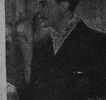
Se anuncia el estreno de "Adios, mister Chips", del director Sam Wood, con Robert Donat como primer intérprete.

CINE ALCANTARA Magnífico programa doble La puerta de las siete cerraduras Y La mujer invisible (2.ª SEMANA)