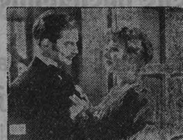
Se anuncia el estreno de "Adios, mister Chips", del director Sam Wood, con Robert Donat como primer intérprete.

CINE ALCANTARA Magnífico programa doble La puerta de las siete cerraduras Y La mujer invisible (2.ª SEMANA)