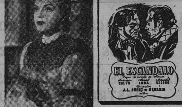
UNA PELICULA DE CALIDAD

"El Escándalo", no sólo es una película, es, además, la obra más audaz de las películas tendientes a que la cinematografía española pueda abocar. "El Escándalo" será la obra que gane para nuestra cinematografía la mejor ocasión de asomarse al mundo y conquistar mercado. José Luis Sáenz de Heredia ha hecho una película de calidad, ambiciosamente tan sólo, en un sentido y patriótico anhelo, dar cuanto de grande y hermoso hay en lo español, con una expresión auténticamente española.