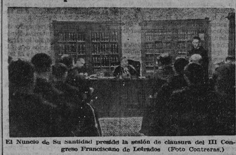
El Nuncio de Su Santidad preside la sesión de clausura del III Congreso Franciscano de Estudios.