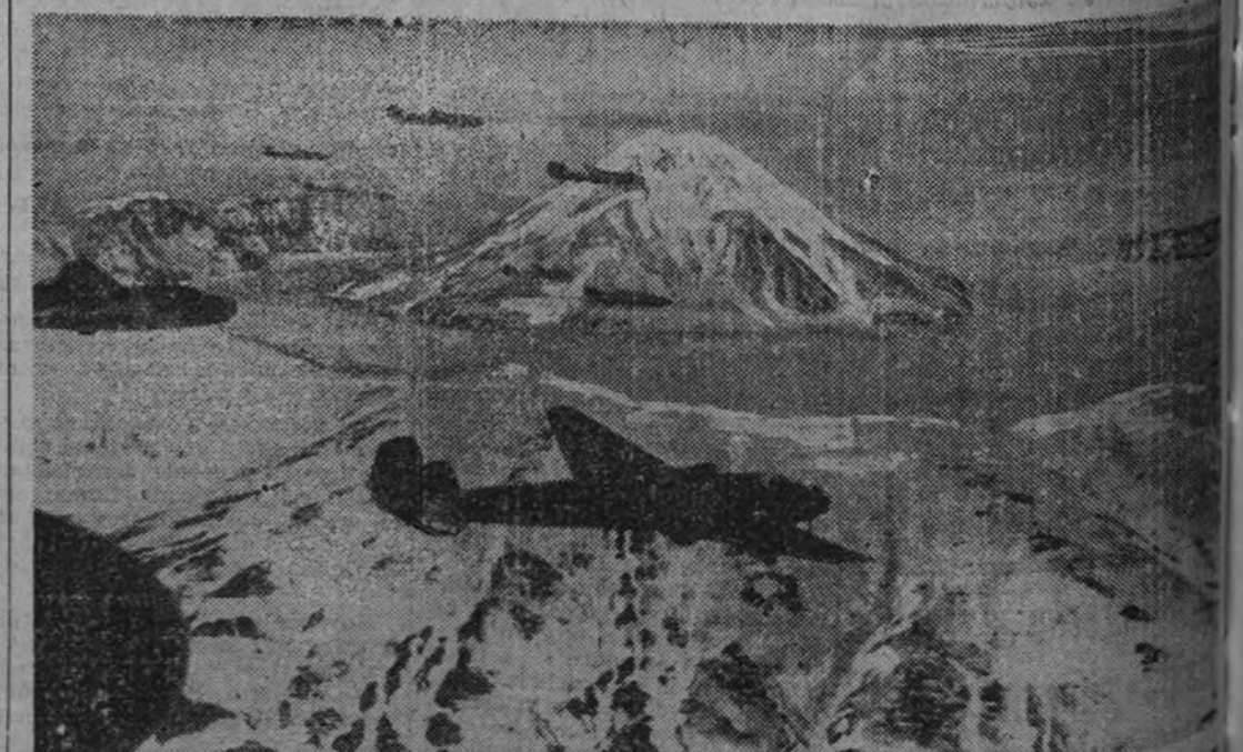
Un avión japonés tiene que desempeñar duros servicios, desplazándose a enormes distancias de bases, por las especiales condiciones del escenario de la contienda. Estos bombarderos están efectuando servicio de «reconocimiento ofensivo» sobre las islas ocupadas por los norteamericanos en el grupo de las Aleutianas