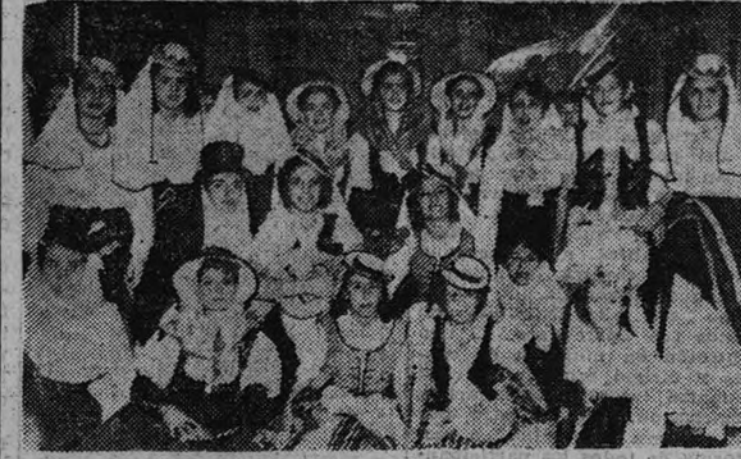
Los coros de Orense

PRIMER PLANO ha re- volucionado la forma de hacer y presentar las revistas cine- matográficas.