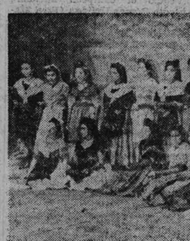
Los coros de Tarragona

Es muy corriente en nuestra nación ensalzar "a priori" cuanto se nos presenta de otros países, valorar su mérito con un criterio a veces demasiado benevolente; lo es también juzgar lo nuestro con du- rezza, criticarlo excesivamente, es- quivar el entusiasmo sincero, la manifestación de júbilo ante lo magistral.