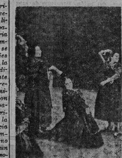
Exhibición de uno de los grupos

La nota folklórica, servida a tra- vés de la más pura y acertada vi- sión, arrancó las manifestaciones de entusiasmo de la concurrencia en todo momento.