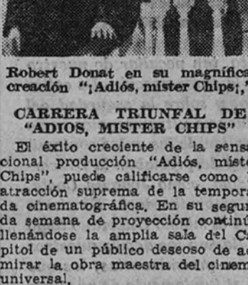
Robert Donat en su magnífica creación "Adiós, mister Chips".