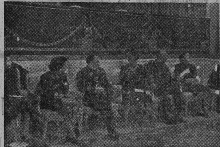
El Jefe del Estado y el Ministro Secretario General, con sus respectivas señoras, la Delegada Nacional y otras jerarquías de la Sección Femenina, durante la actuación de los coros.

Ante Su Excelencia el Jefe del Estado y Generalísimo de los Ejércitos actuaron ayer en El Pardo los grupos de coros y danzas de la Sección Femenina, que en días pasados fueron cálidamente ovacionados en el teatro María Guerrero.