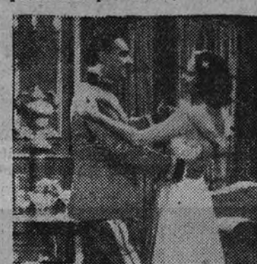
Alida Valli en "Baile en el castillo", film que figura en la cartelera del cine Alcantara.

Estrellita Castro tiene en "La patria chica" ocasión de resumir los aciertos que la encumbraron a su alto título, María Filma, la nueva productora madrileña, puede ufanarse de iniciar su programa con esta producción, que será presentada por Cifesa.