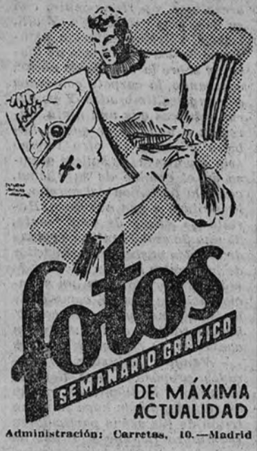
Administración: Carretas, 10.-Madrid