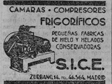
ZUBRANG 14, tel. 46.564, MADRID

Los aliados preparan la contraofensiva MELBURNE 23. (Crónica especial transmitida por radio).—El comunicado oficial de hoy no registra cambio alguno en la situación de la región septentrional de Finschhafen, donde parece que los ataques japoneses han perdido fuerza por la primitiva violencia. Esto no quiere decir que las operaciones de las últimas doce horas hayan sido menos importantes que las de mediados de semana, sino, que, por el contrario, han sido, si cabe, más decisivas. El peso principal de las luchas en este sector de Nueva Guinea recayó ayer sobre la Aviación aliada, pues la japonesa apenas se dejó ver sobre el campo de operaciones. Según las manifestaciones del portavoz oficial de Mac Arthur, se ha efectuado la operación aérea de mayor envergadura sobre Nueva Guinea desde que comenzó la campaña por la reconquista de esta isla. Los ataques lanzados por los japoneses en la tarde del viernes y mañana del sábado con apoyo de artillería ligera, fueron rechazados por las fuerzas australianas, que, después de haber sido reforzadas en las últimas veinticuatro horas, han impedido que los japoneses progresaran hacia la línea del Song. La llegada de refuerzos australianos a esta zona continúa, debiéndose contar con una pronta contraofensiva aliada lanzada hacia el Norte para arrojar al mar a estas fuerzas que durante la noche siguen siendo aprovisionadas y aumentadas con nuevos destacamentos de infantería. La Aviación aliada atacó también en la última jornada las ins-