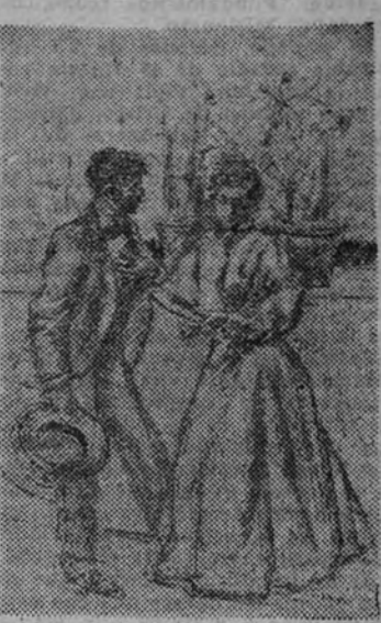
Dibujo de Huertas

De la Real Academia de Bellas Artes de San Fernando