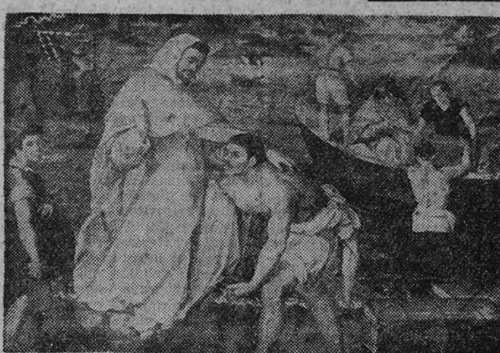
San Pedro Nolasco embarcándose para redimir cautivos, cuadro de Francisco Pacheco

La Orden de los Trinitarios o de la Santísima Trinidad se fundó en el año 1198 por San Juan de Mata. El fundador, natural de Provenza (Francia), tuvo una revelación cuando se hallaba un día oficiando en París. Al rogar a Dios, en el