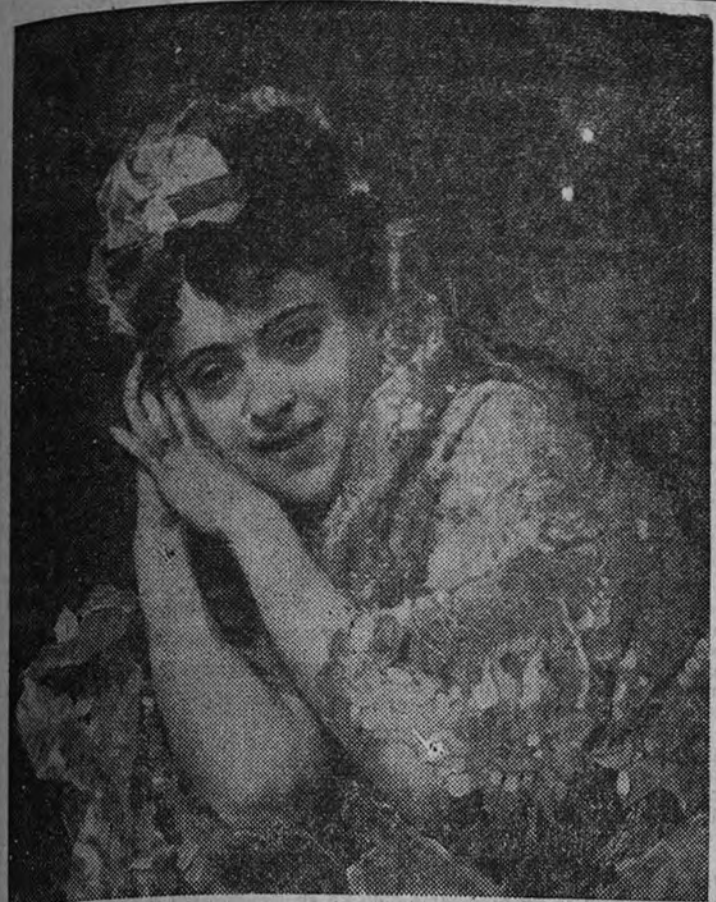
"Retrato", por el pintor Madrazo