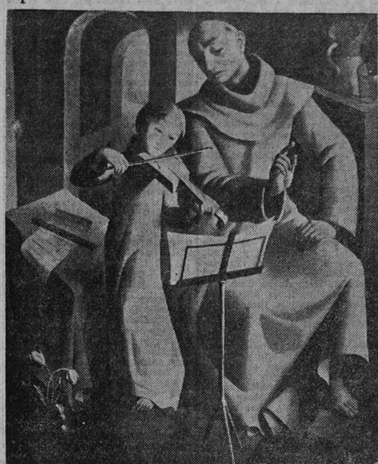
"El profesor", por Francisco Lorente

Benlliure y Marinas esculpirán una alegoría de las danzas canarias