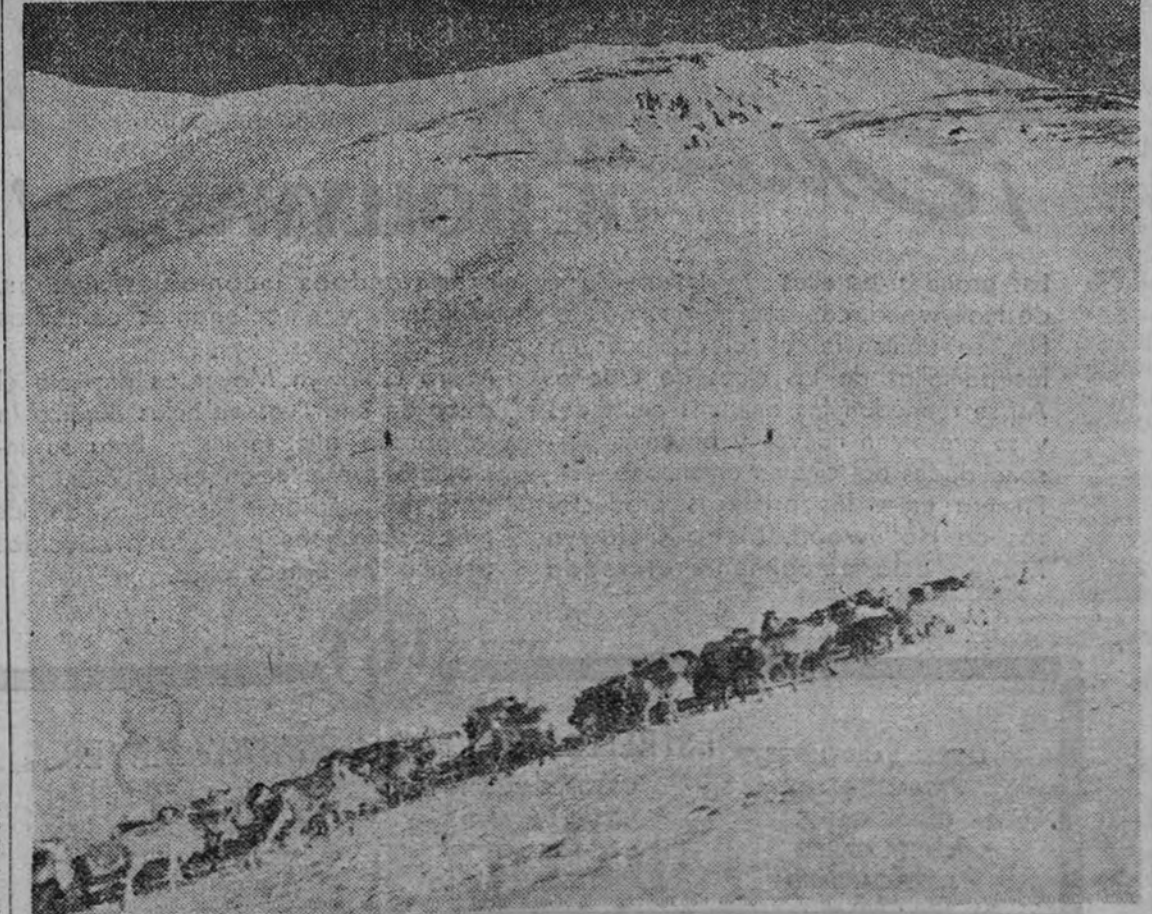
Se aproxima el invierno y los renos han de emigrar en busca del necesario sustento. Este rebaño que recoge nuestro grabado se encuentra en la alta montaña y va a atravesar un puerto buscando la vertiente contraria más propicia por su clima y su vegetación

Inicia sus sesiones el Congreso anual de Sindicatos de Finlandia HELSINKI 23.—Con asistencia de 200 delegados, entre ellos seis comunistas, ha iniciado sus sesiones el Congreso anual de Sindicatos finlandeses. En el curso de las deliberaciones, que durarán cuatro días, se tratarán cuestiones relativas a la huelga y abastecimiento de la población. (Efe.)