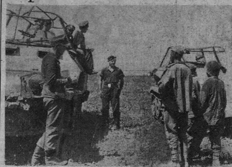
Después de un contraataque alemán, un grupo de soldados rusos cayó en poder de las fuerzas alemanas. Interpretes del Reich tomaron inmediatamente declaración a los prisioneros, que revelan datos importantes del desarrollo de la batalla.