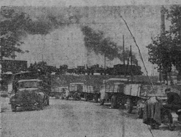
Una columna de camiones alemanes espera ser cargada en una estación para retirar toda clase de material