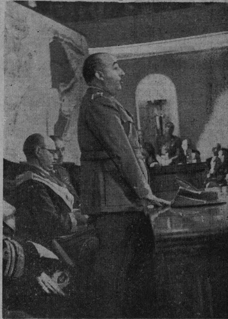
El Caudillo pronuncia su discurso

el éxito, a pesar de la obstinada resistencia de los bolcheviques. Han sido destruidos numerosos carros blindados, y un pequeño grupo de enemigos, que había sido cercado, fué totalmente aniquilado. En el resto del frente del Este no ha habido más que combates de importancia local. Ha sido aniquilado un grupo adversario que intentaba ocupar una isla del Dniéper, al este de Cherkassy. «MARCA» comunica a sus lectores diariamente la máxima actualidad deportiva. Es el mejor periódico de su especialidad.