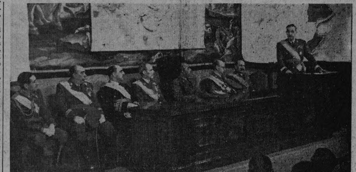
Franco preside el acto inaugural

La conferencia inaugural corrió a cargo del general director del Alto Centro, don Alfredo Kindelán, el cual dió comienzo a la misma con frases de gratitud hacia Su Excelencia por su presencia en las tareas de iniciación del curso, destacando la gesta de la Cruzada y la admirable dirección de aquella bajo el Caudillo, exaltando los grandísimos aciertos en la