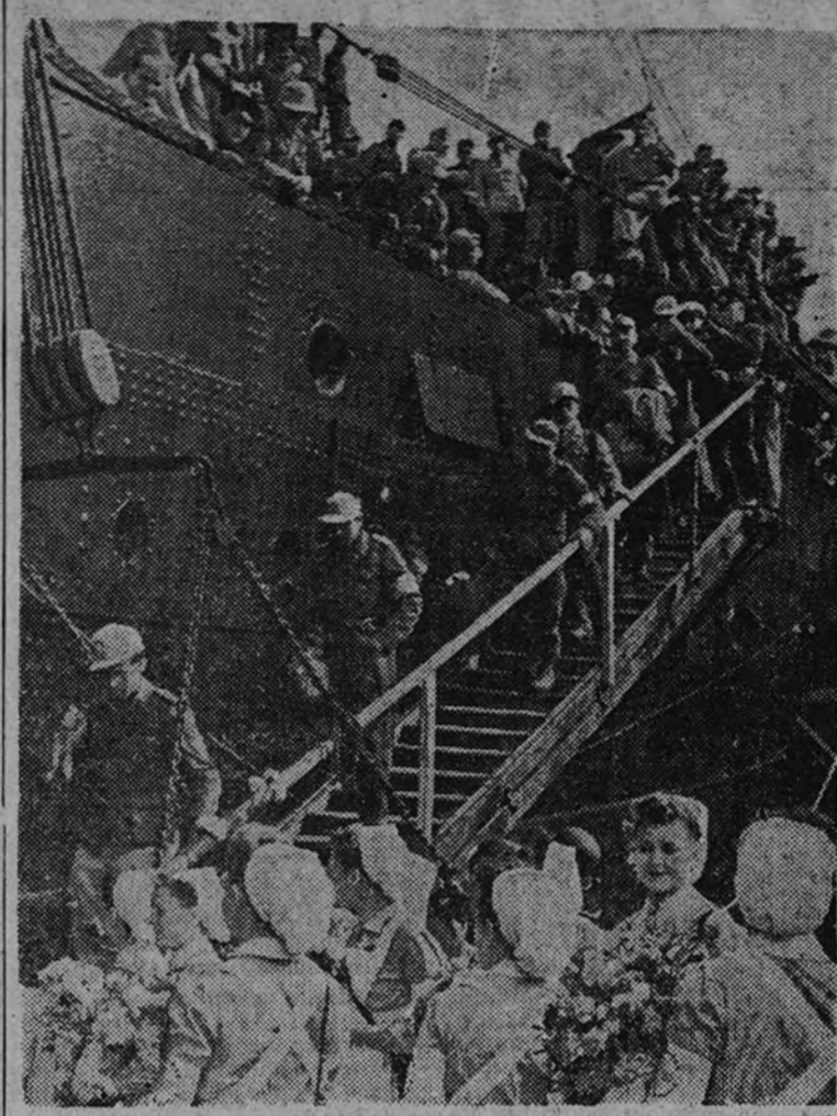
Los ex prisioneros alemanes canjeados en Barcelona llegan a Marsella, donde abandonan el barco para continuar su viaje a la patria por vía terrestre. Sus jóvenes compatriotas encuadradas en el servicio de la Cruz Roja Alemana les obsequian con un ramo de flores