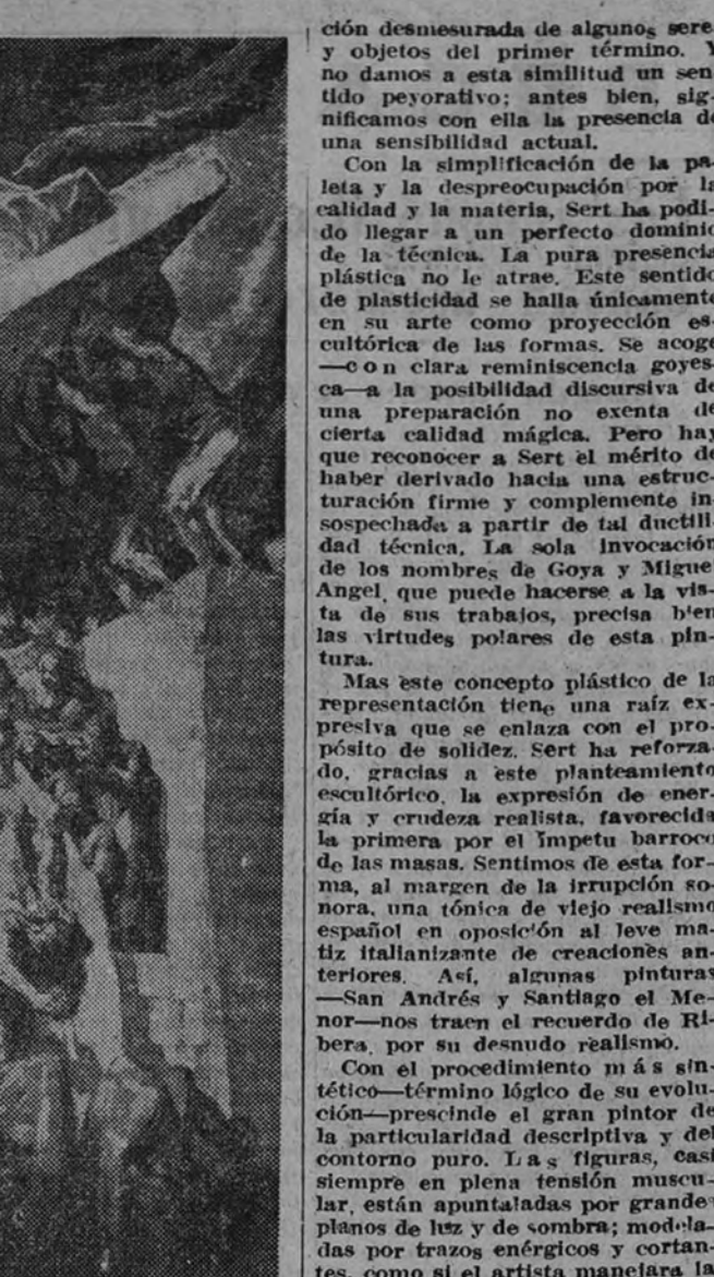
La activa flecha de mi templo entonces tus glorias últimas.