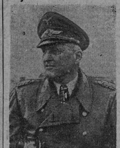
Korten, general de Aviación, que ha sido nombrado jefe de Estado Mayor del arma aérea.