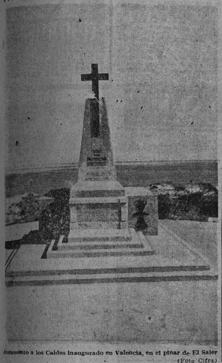
Monumento a los Caídos inaugurado en Valencia, en el pinar de El Saler.