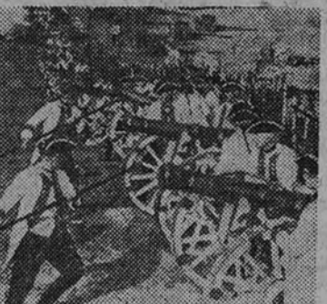
Fotograma de "El gran rey", uno de los mayores y más merecidos éxitos de la temporada.

pasar de una sonrisa, al mismo tiempo que enardece los sentidos, como en un apasionado giro de vals, llena de optimismo el corazón. Humor, gracia, música y amor. Estos son los ingredientes de que se vale Willi Forst, alquimista excelso, para destilar por el alambique de su fantasía ese licor que nos sirve, en copa de oro y con burbujas de piedras preciosas, en "Sangre vienesa", su última realización.