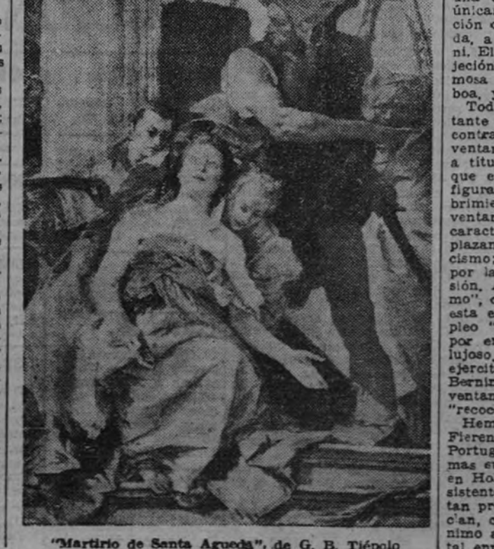
"Martirio de Santa Agueda", de G. B. Tiepolo