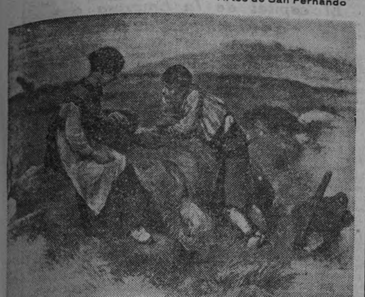
Un dibujo de Regidor