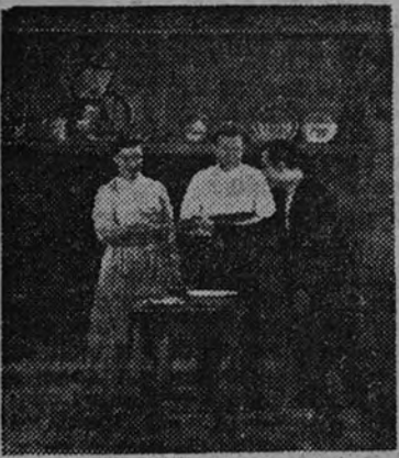
Una escena de la película "El camino del amor".