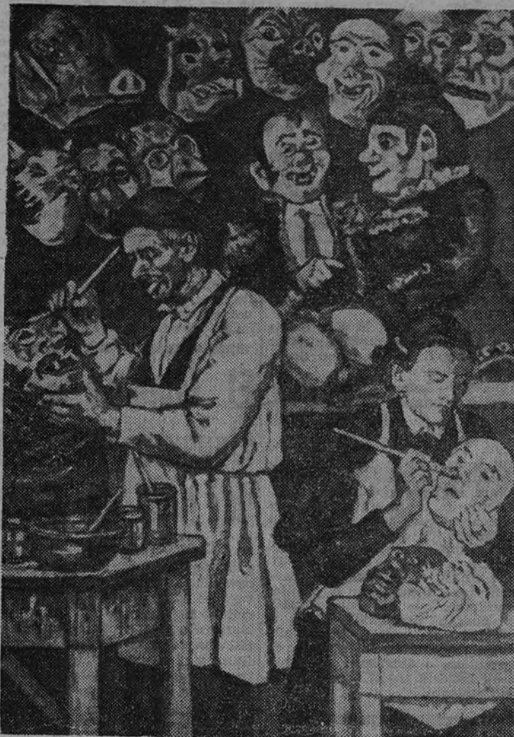
"Pintor de cartitas", por Solana

Después de la apasionada polémica suscitada en torno a la pintura de Solana, con motivo de su envío a la última Exposición Nacional, llega oportunamente esta exhibición más completa de su obra. En ella figuran cuadros conocidos que precisan o bien los distintos momentos de su arte: desde la primera época hasta la encendida policromía de las creaciones actuales. La diferencia de calidad —pues no se trata, en rigor, de una selección—, sin embargo, en esta ocasión un juicio definitivo. Es preciso tener en cuenta toda la labor realizada por el eximio pintor para medir el alcance de su personalidad o, al menos, aquellas obras que por su intrínseco valor habrán de quedar sin duda entre las más altas y originales de la pintura europea contemporánea.