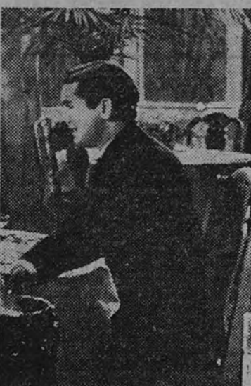
Tyrone Power, galán de "Chicago", film que interpretan también Alice Faye y Don Ameche, y que entra en segunda semana de proyección en el Imperial.

LA NOVELA DE "SU VIDA INTIMA" La producción Universal "Su vida íntima" se halla basada en la novela de Fannie Hurst "Back Street", que fué publicada como folletín en la revista norteamericana "Cosmopolitan". En 1932, debido al éxito extraordinario alcanzado, se publicó una edición especial que alcanzó una tirada superior al millón de ejemplares. Es sin duda la novela favorita del Nuevo Mundo y una de las profundamente conmovedoras. La cinta cinematográfica, dirigida por Stevenson, sufre acaso en emoción e interés al de la propia novela. Charles Boyer y Margaret Sullivan, una pareja incomparable encarnan a los héroes de Fannie Hurst con una sinceridad emocionante.