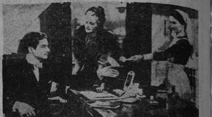
Una escena de la realización de King Vidor. "La ciudadela", que interpretan Robert Donat y Rosalind Russell, y que será presentada en el cine Avenida.

Si en su despacho, sala de consulta o recibimiento esperan mujeres elegantes, tenga presente este detalle: la Revista para la mujer "E.Y. La espera con "E.Y. es mucho más agradable.