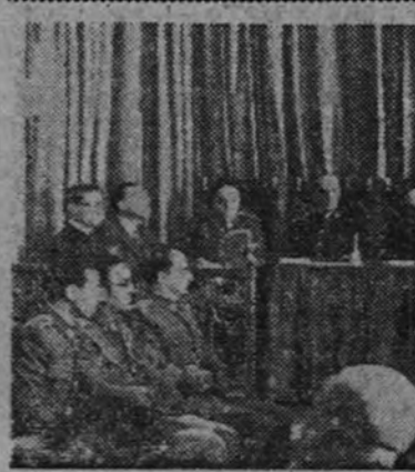
El ministro del Ejército, con otras personalidades, en el acto de clausura de curso de Defensa Pasiva contra la Guerra Química.

El 8 de septiembre le obliga a apresurar su regreso a Italia. Después de veintidós años el férreo lugués vuelve a pisar tierra italiana. Antes celebra entrevistas en Washington y en Londres. Y ahora llega el abrazo de Nápoles. La Rüter afirma que ha existido un acuerdo. Sforza puede olvidar por un momento y esperar. Sabe que el tiempo y la exasperación del pueblo cumplirán su tarea. Pero él tiene setenta y cinco años, y Roveda, el líder torinés del comunismo, cuarenta y cinco. El lugués, llega tarde, pero llega. Como dicen en los «danzings» de Niza las muchachas, adopto tutti questi gual un luquese non manca mais.