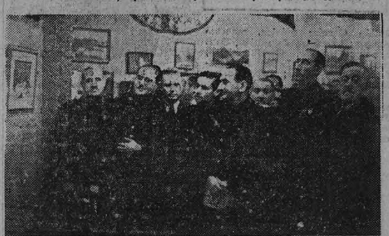
El Ministro Secretario del Partido, con el Vicesecretario General y otras personalidades, en el acto de clausura de la III Exposición Nacional de Arte de Educación y Descanso.

El Jefe Nacional de la Obra Sindical de Educación y Descanso, camarada (Continúa en sexta página.)