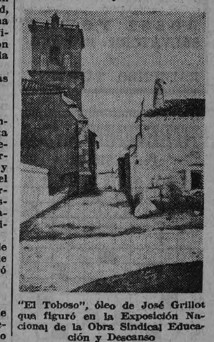
"El Toboso", óleo de José Grillo. Que figuró en la Exposición Nacional de la Obra Sindical Educación y Descanso