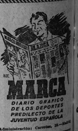
Administración: Carretas, 12.—Madrid

El pueblo rumano siente una especial devoción por sus Reyes, a quienes se ha vinculado la prosperidad y la libertad de su país. Miguel I es el cuarto Soberano de la dinastía Hohenzollern-Sigmaringen. El primero, Carlos I de