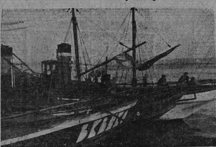
Miles y miles de hombres de mar, a bordo de estos pequeños vaporcitos, arrancan al mar esos 1.000 millones de pesetas, base de nuestra economía pesquera

Para dar una idea de lo que equivale a valor esta pesca capturada a través de la preparación y conservación, añadiremos que en