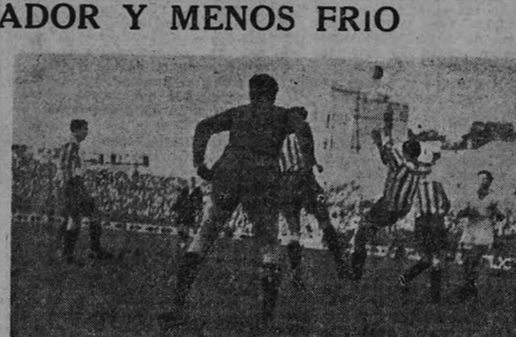
Partido Madrid-Español en Chamartín. Un momento de peligro ante la meta de Español.

matismo. Es un fútbol demasiado "sedoso".