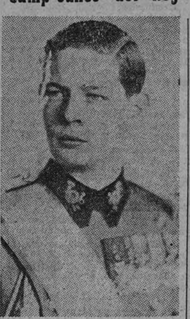
Hohenzollern, consolidó la unión de los Principados de Moldavia y Valaquia, consiguiendo el reconocimiento de la independencia de Rumania en el Congreso de Berlín de 1878; y desde entonces la dinastía es la encarnación visible del ideal rumano de independencia, de cultura y de unión nacional. De Carol I al actual Miguel I el país entero ha sufrido una asombrosa transformación en lo espiritual y en lo material, que hace verosímiles los vaticinios más halagüeños para el pueblo rumano.

Miguel I ha crecido entre los venes de las escuelas públicas y de las organizaciones premilitares, participando con ellos de las inquietudes y de los anhelos de la juventud. En derredor suyo, la nación rumana forma en la lucha que sostiene actualmente por su existencia y por su honor.