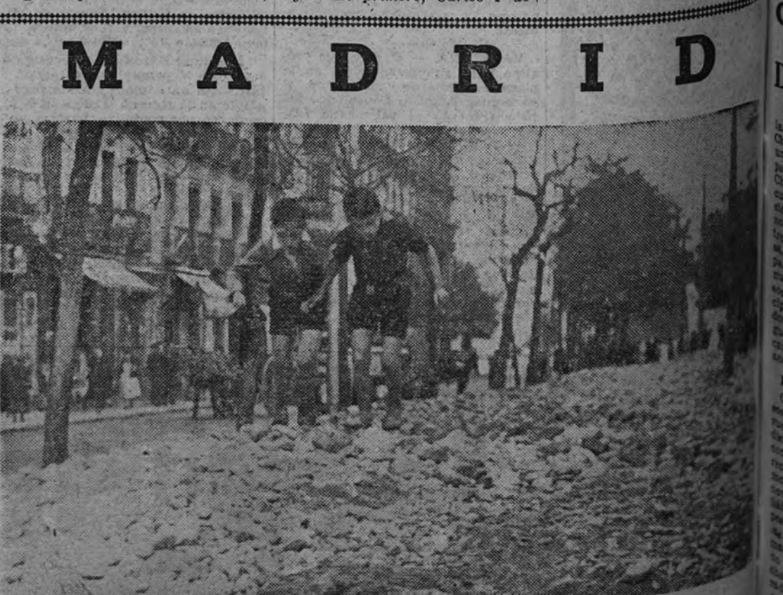
Las obras antes de su terminación

reñiriéndose a la situación militar en Italia, la siguiente noticia: “Las últimas informaciones señalan que el quinto Ejército, partiendo de Venafro, ha realizado un importante avance. Las tropas del general Clark se encuentran a más de 15 kilómetros al norte de Venafro. El ala derecha del octavo Ejército realiza también avances considerables desde Vasto: un grupo numeroso del enemigo ha sido desbordado en este sector. El quinto Ejército ha ocupado Mignano, situada en la principal carretera interior y en la línea ferroviaria que conduce a Roma, a unos 12 kilómetros de la bifurcación de la carretera lateral que termina en Isernia.