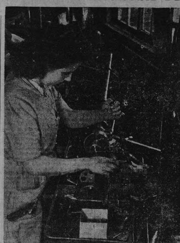
La introducción de los metales ligeros, en forma cada vez más crecida en los progresos de la mecánica, alientan, al mismo tiempo, la progresión de la mano de obra femenina

Existente en economía un principio que se cumple fatalmente. Y es el que se refiere al consumo de las primeras materias esenciales y de