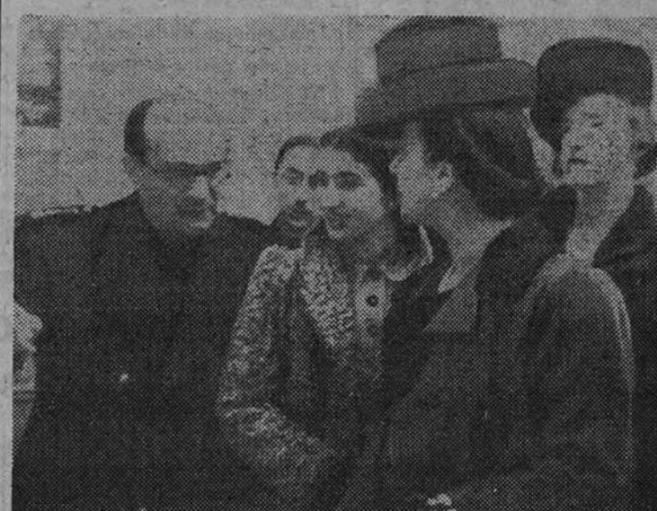
La esposa del Caudillo, con su hija y el Ministro de Educación Nacional, en la inauguración de la Exposición de Artesanía

Fueron recibidas por el Ministro de Educación y numerosas jerarquías