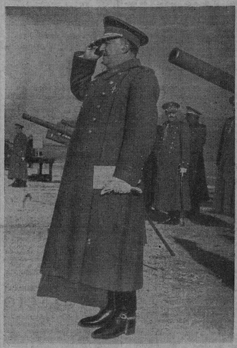
El Jefe del Estado, en el desfile de las tropas que le rindieron honores

El correspondiente especial de la agencia Reuters declara que en muy pocos días se aclarará si los defensores podrán sostener o no la posesión de la isla. Agrega que los alemanes hacen todo lo posible por conquistar la isla para mantener el círculo de hierro en el mar Egeo, que se vió roto recientemente por la ocupación aliada de Cos, Samos y Leros. (Efe.)