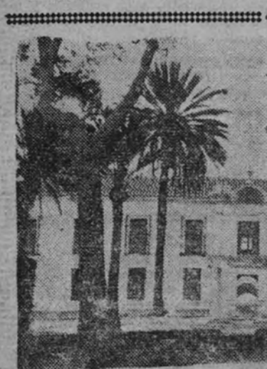
Palacio de Castilla

La guerra, el reportaje nacional y extranjero, el deporte, el cine, la música, el humor, la moda, las variadas facetas de la vida actual se encuentran recogidas con acertado equilibrio en la Revista «RADIO NACIONALES».