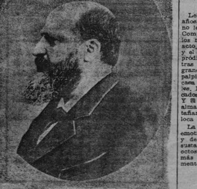
Pedro Antonio de Alarcón

«Llenóse la platea, la noche del estreno, de periodistas, poetas y artistas de todas las categorías y condiciones, y de aficionados a las primeras representaciones, en quienes la de aquella noche había excitado mayor curiosidad. Aun antes de levantarse el telón ya se veía el espíritu de hostilidad que dominaba en una gran parte de los que habían de juzgarle: los chistes de unos, los ataques no disimulados de aquellos que deseaban ventajarse del crítico que tan severamente había juzgado sus obras, y el desdichado estratagemas, propio siempre de la competencia que se eleva, formaban aquella noche una atmósfera tan contraria a la obra de Alarcón, que bien a las claras se veían las malas condiciones con que penetraba en el palenque dramático; y sin esperar a