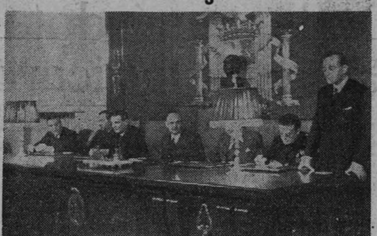
El Subsecretario de la Gobernación y el Presidente de la Diputación, con otras personalidades, presidiendo el acto de toma de posesión de la nueva Directiva del Colegio de Médicos