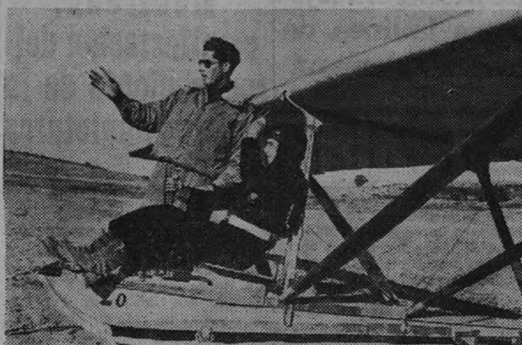
Antes de iniciar el vuelo el alumno escucha las indicaciones del profesor

No puede asegurarse todavía en qué medida la conquista del aire influirá en la marcha del mundo; pero sí en la trascendencia importancia que para las dos actividades fundamentales de la humanidad tiene: las comunicaciones y la guerra. En el primer aspecto ha revolucionado todos los sistemas establecidos hasta ahora. Regiones consideradas inaccesibles fueron alcanzadas; desiertos y cordilleras, océanos y bosques han sido superados. El ferrocarril y la máquina de vapor en el mar