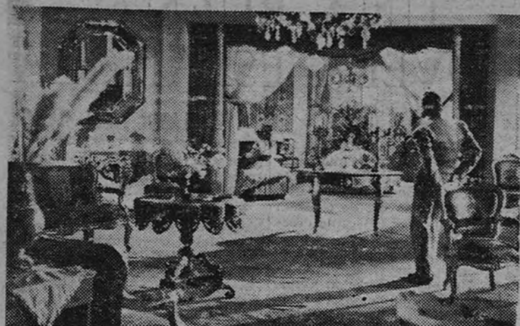
Una escena de "El escándalo". "El escándalo" entra en su séptima semana en el Palacio de la Música, logrando para la producción española un extraordinario éxito.