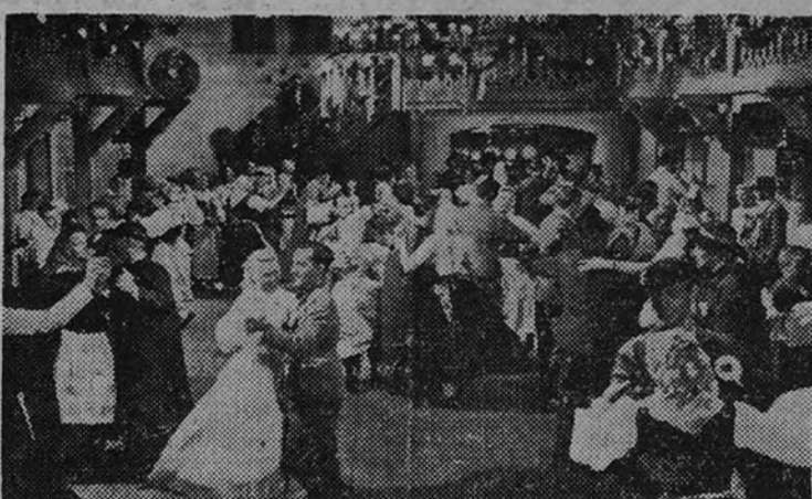
"La ciudad soñada", creación de Cristina Soderbaum, que mañana estrena el cine Palacio de la Prensa, está realizada por el procedimiento Agfa-Color, y es una revelación de la nueva cinematografía.

JACK HOLBERT Distribución: F. PUIGVERT (2575 A)