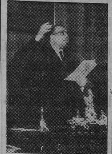
El Ministro de Justicia, en un momento de su discurso.

Decía Lacordaire que la muerte es la última arma del justo contra la tiranía, y nosotros, españoles, sabemos lo que puede esta arma suprema, porque la guerra cruenta que flageló nuestra Patria la han ganado tanto aquellos que por España murieron como quienes vivieron en su servicio y a ella se entregaron con denuevo, fundiéndola milagrosamente en este terrible crisol en que parecían jun-