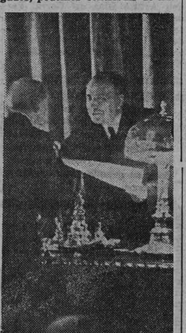
El Ministro de Justicia, señor Aunós, entrega los pergaminos a los abogados que cumplieron las bodas de oro con el Colegio.

Por ello nuestro deber tras la terrible prueba pasada es dar a España esa estructura religiosa y jurídica, con fisonomía moral que exigen de consuno nuestros muertos y nuestros héroes, presentes unos con el fulgor de su recuerdo y los otros con su aliento nobilísimo y el calor de su fe inquebrantable. Y en esa tarea que el Caudillo emprendió desde el día mismo del Alzamiento, sustituyendo la arbitrariedad marxista por el sentido de la equidad y el derecho que ha campeado siempre en el Ejército español, nosotros, los abogados, podemos contribuir de ma-