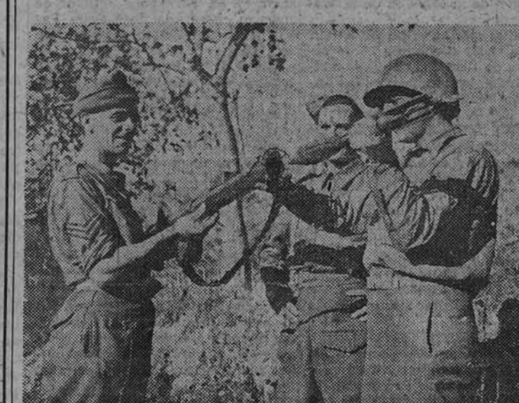
Un soldado americano enseña a dos británicos de una unidad de «comandos» la manera de usar este arma antitanque, de invención norteamericana, y que ha dado muy buenos resultados