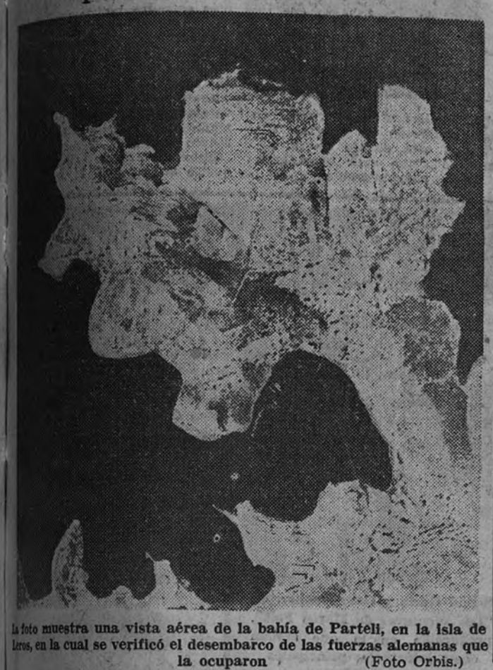
La foto muestra una vista aérea de la bahía de Partell, en la isla de Leros, en la cual se verificó el desembarco de las fuerzas alemanas que la ocuparon.