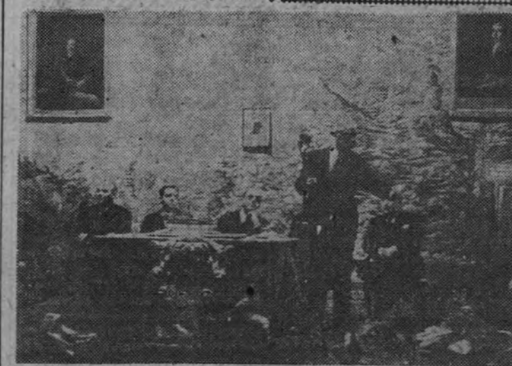
El Ministro de Marina preside el acto celebrado ayer en el Museo Naval. La foto recoge un momento de la conferencia del señor Pemán.