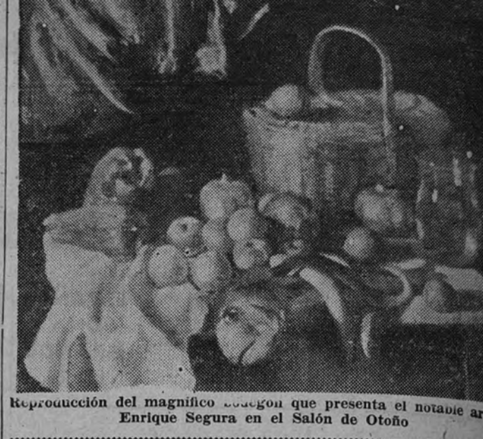
Reproducción del magnífico boceto que presenta el notable artista Enrique Segura en el Salón de Otoño