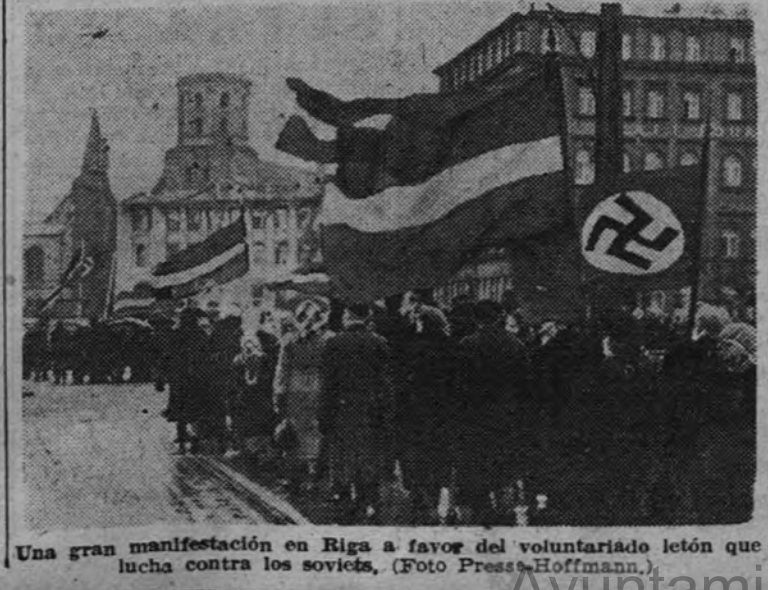
Una gran manifestación en Riga a favor del voluntariado letón que lucha contra los soviets.