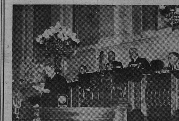
El presidente del Consejo de Portugal, señor Oliveira Salazar, durante el discurso de apertura de la Asamblea Nacional.

Telegrama del Ministro de Asuntos Exteriores al presidente del Gobierno de Portugal: