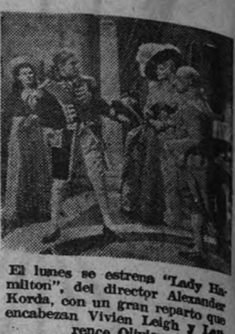
El lunes se estrena "Lady Hamilton", del director Alexander Korda, con un gran reparto que encabezan Vivien Leigh y Laurence Olivier.