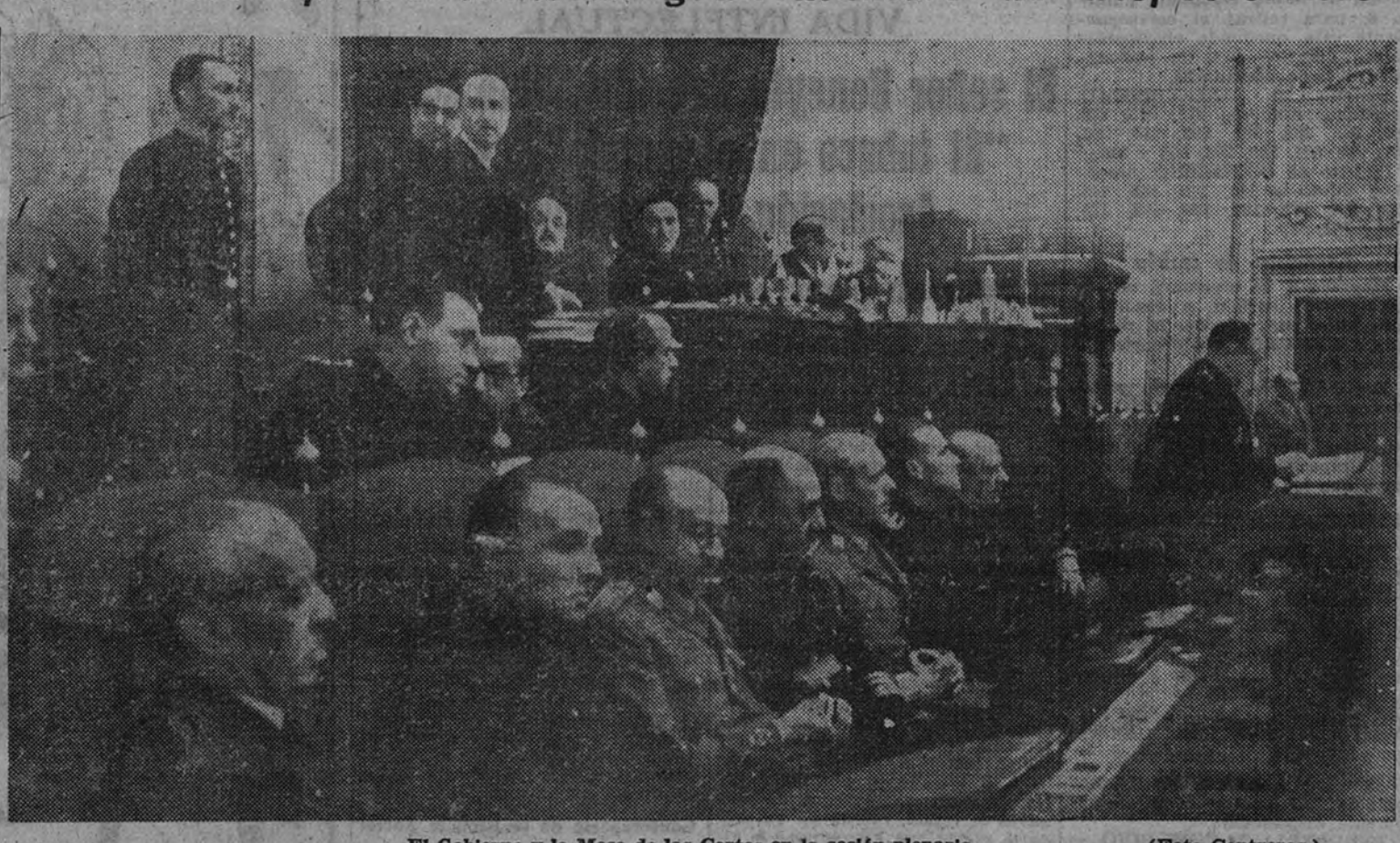
El Gobierno y la Mesa de las Cortes en la sesión plenaria

No le declamos lo que es la gran revista «FOTOS» nor- que usted la conoce perfectamente. «No la compra todos los domingos» «FOTOS» es... fotos de actualidad.