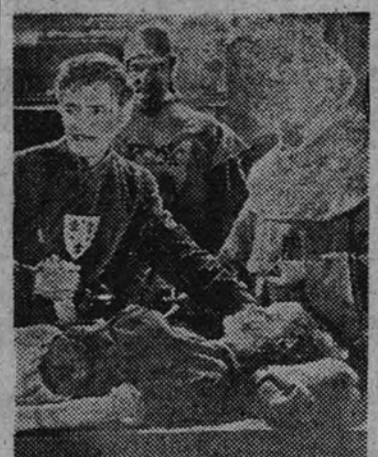
Ronald Colman en "Si yo fuera rey", del programa doble del cine Chueca

Vicent Korda, director del film, diseñó y construyó los fastuosos decorados de esta película, los cuales no admiten comparación con nada visto últimamente. Entre los "sets" que más provocan la admiración se encuentran la monumental Embajada británica en Nápoles, escenas en la nave capitana de Nelson, la Cámara de los Lores en Londres y los encantadores aposentos de la reina de Nápoles. Todo esto ofrece a la película los más deliciosos matices de ambiente y colorido que tan importante papel juegan en esta grandiosa producción.