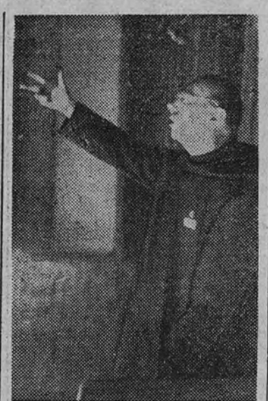
Fray Justo Pérez de Urbel en un momento de su discurso

Comenzó el acto con la intervención del Asesor Religioso Nacional de la Sección Femenina, Consejero Nacional fray Justo Pérez de Urbel, con una exposición magnífica de alto valor significativo de la fiesta en todo su