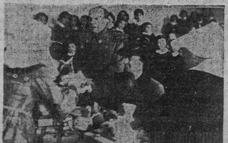
La esposa del Caudillo en la Escuela de Huérfanos

En el Colegio de San Diego, Fundación Valdejo, donde se hallan internadas ochenta niñas huérfanas de militares y setenta acogidas a la benéfica Fundación, se celebró ayer mañana un acto al que asistió la esposa de S. E. el Generalísimo, doña Carmen Polo.