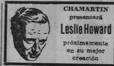
CHAMARTIN presentará Leslie Howard próximamente en su mejor creación (2067 P)

El conferenciante estudió desde los distintos aspectos: geográfico, arqueológico, de construcciones y de tráfico, los puertos de las cuatru villas cántabras: Santander, Santoña, Laredo y Castro-Urdia.