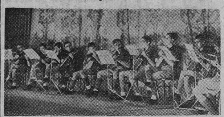
La rondalla del Frente de Juventudes durante su concierto.

Como preparación a la fiesta del Día de la Madre, que el Frente de Juventudes celebrará mañana, 8 de diciembre, solemnidad de la Inmaculada Concepción, en el teatro Madrid tuvo lugar en la mañana del pasado domingo un gran acto, que estuvo matizado por el más vivo espíritu falangista al servicio de la emotiva significación espiritual de aquella celebración.