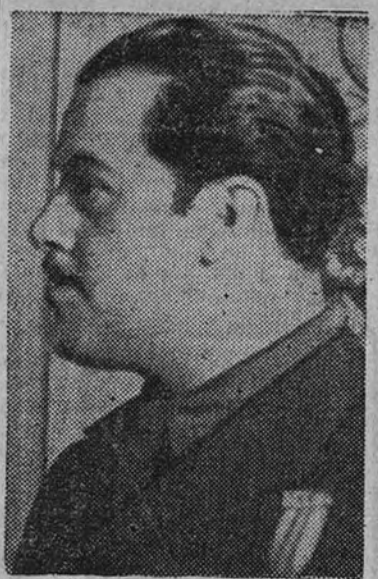
El Ministro llega a Bouzas

Aquí estamos para cubrir dos objetivos esenciales: el primero, inspeccionar por nosotros mismos vuestras condiciones de trabajo, recoger vuestras reivindicaciones más urgentes y estudiar con nuestros técnicos sobre el terreno las fórmulas posibles de servirlos. Labor esencial, porque debéis suponer la imperfección con que se ven desde lejos, oscurecidos entre tantos problemas diferentes, los verdaderos perfiles de una situación. Para esto no es buen sistema salir solos a una tribuna y hablar, sino entrar con vosotros en una Delegación Sindical y obrera. Directamente a mis compañeros de trabajo y a mi habréis de exponer con absoluta sinceridad todos los extremos que os interesen y responder a las preguntas que se os hagan. A las Delegaciones Sindicales compete la organización de este servicio.