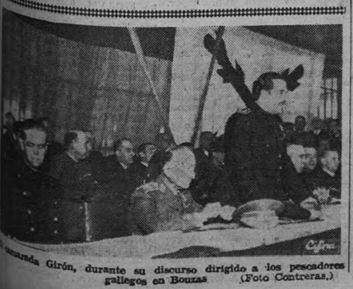
Mariscal Girón, durante su discurso dirigido a los pescadores gallegos en Bouza.

Todo esto, para servicio de España, ha hecho Franco, Caudillo de un Ejército que él condujo a la Victoria. España, que sabe bien lo que a éste debe y lo que Franco está haciendo en su labor de cada día, siente hoy el orgullo de su Caudillo y de su Ejército. Por eso, en la fiesta de la Inmaculada Concepción, Patrona de la gloria, que le dio con su sangre nueva vida y nuevo rumbo, y se siente una vez más, en la eficacia de sus instituciones armadas, firmemente dirigida por la mano de su creador de este soldado que recogió un día la tradición española, para unirlos a los mejores antepasados.