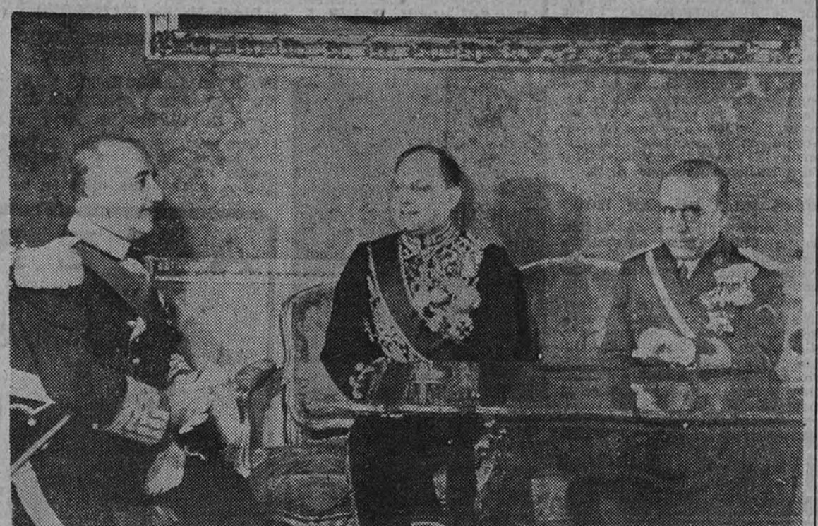
El nuevo representante diplomático, después del acto oficial, conversa con el Caudillo y el Ministro de Asuntos Exteriores

El Gobierno, altas jerarquías, autoridades y representaciones concurrieron al acto