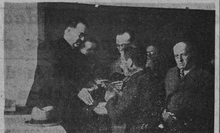
El Subsecretario de Justicia en la inauguración de la Escuela de Capacitación de la prisión de Yeserías.

Presidió el Subsecretario de Justicia, a quien acompañaron otras personalidades