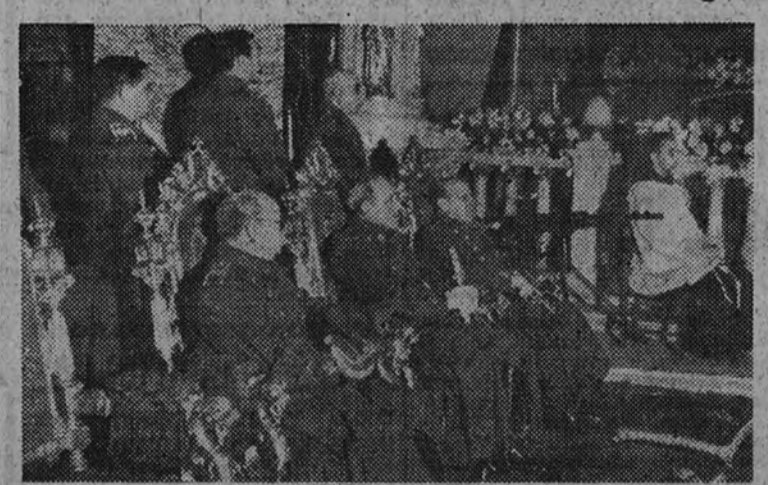
Los Ministros de Asuntos Exteriores, Ejército y Aire presiden la solemne función religiosa celebrada en la Iglesia de San Francisco el Grande

En la mañana de ayer, con motivo de la festividad de la excelsa Patrona del Arma de Infantería, la Inmaculada Concepción, y organizada por la Asociación de Damas de María Inmaculada, se celebró solemnisísima función religiosa en el templo de San Francisco el Grande, con la presencia de la esposa del Caudillo, excelentísima señora doña Carmen Polo de Franco. Concurrían también los Ministros de Asuntos Exteriores, teniente general conde de Jordana; del Ejército, general Asensio, y del Aire, general Vigón; Capitán General de la primera región, teniente general Saliquet; Gobernador Militar de la plaza, general Sáenz de Buruaga, y otras muchas personalidades. El templo se encontraba magníficamente iluminado y adornado con plantas y flores. En el altar mayor figuraban la imagen de la Purísima, rindiéndole homenaje la bandera nacional. Figuraron los guiones de todos los regimientos de Infantería y los atributos del Arma de Infantería. En el atrio, formando pasillo, se encontraban la sección de honor del batallón del Ministerio del Ejército, portadora de los guiones