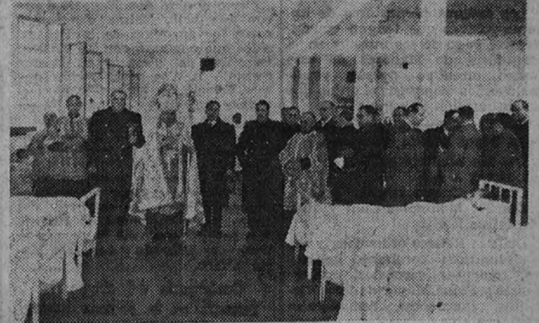
El Ministro de Justicia, con el obispo auxiliar de Madrid y otras personalidades, en la inauguración del hospital de la Prisión de Yeserías

Bendijo las dependencias el obispo auxiliar, concurriendo al acto numerosas personalidades