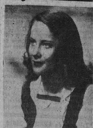
Alida Valli, uno de los rostros más expresivos y verdaderamente dramáticos del cine actual

Y es en «Tiempos pasados»—según la novela «Pequeño mundo antiguo»—donde Alida Valli encuentra y alcanza definitivamente su personalidad. Su exquisita labor