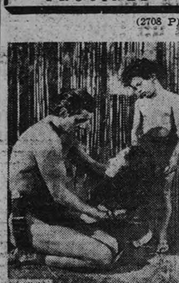
Una escena de "Tarzán y su hijo", que interpretan Johnny Weissmuller y Maureen O'Sullivan, y que se estrenará el lunes.