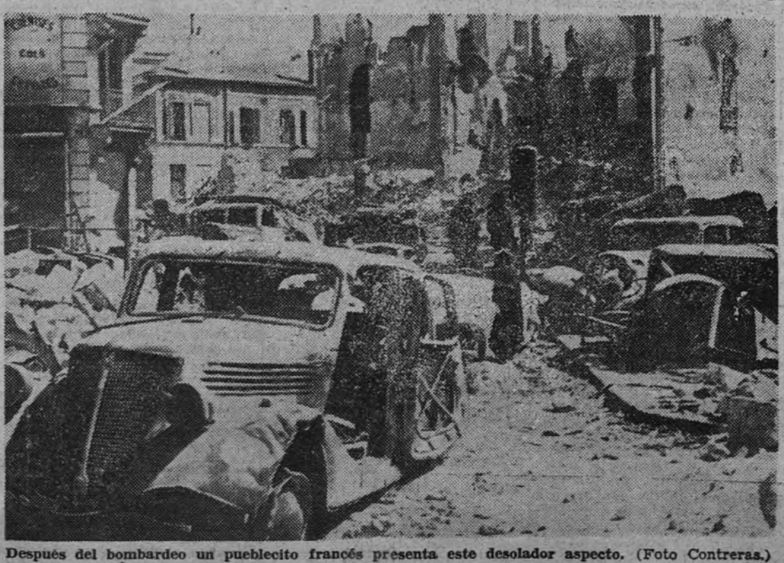
Después del bombardeo un puebloito francés presenta este desolador aspecto.