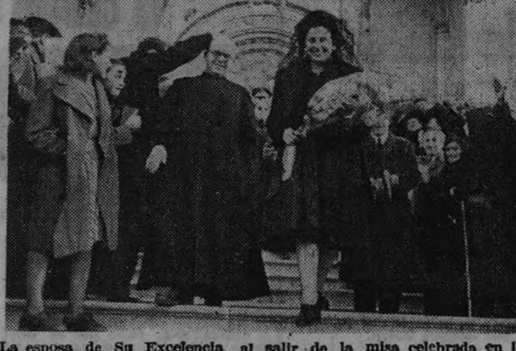
La esposa de Su Excelencia, al salir de la misa celebrada en los Jerónimos

Ayer, a las once de la mañana, se celebró en la iglesia de San Jerónimo el Real una solemne fiesta religiosa que la Organización Nacional de Ciegos dedicó a su Patrona, Santa Lucía.