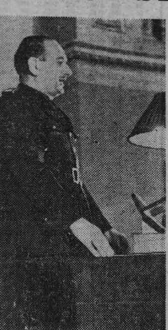
El Ministro Secretario General pronuncia el discurso de inauguración.

LAS LIBERTADES HUMANAS Pero no se crea que porque la Falange quiere cumplir su destino social ha de anular para ello todo lo que es acoero tradicional de libertades humanas, tan rico de valores como lo largo de nuestra Historia. La Falange aspira a ser cualquier cosa menos una dictadura, y si hasta ahora ha vivido en la lucha con su deseo o ha parecido lo contrario de lo que era, ha sido contra su propia esencia y obligada por las consecuencias que traen consigo todas las guerras. Pero normalizada ya la situación moral de España, la Falange ha de emprender su auténtico programa de valorar al hombre y de implicar, en la vida, entero y consciente en la dirección de la Patria.