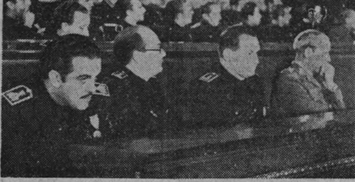
Los Ministros del Ejército, Industria y Comercio, Educación Nacional y de Trabajo, en el acto inaugural.

Si de nuestra doctrina nada ha prescrito y sigue moviéndose la más alta y pura ambición, pocas dificultades hallaremos para resolverlas, y pocas que no podamos resolver. Y si a la vez, a las cuestiones que vamos a estudiar en estas reuniones. Divide a continuación el Vicesecretario General en dos grupos principales los temas propuestos al Consejo. Uno quedará constituido por los problemas de orientación política y otros por los de organización administrativa y burocrática.