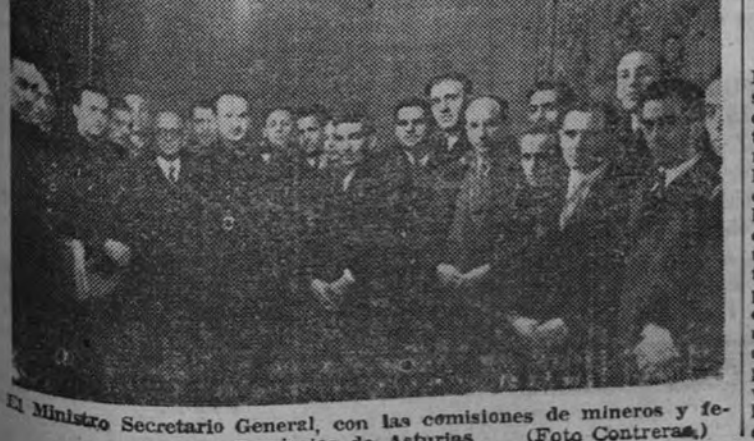
El Ministro Secretario General, con las comisiones de mineros y ferroviarios de Asturias.