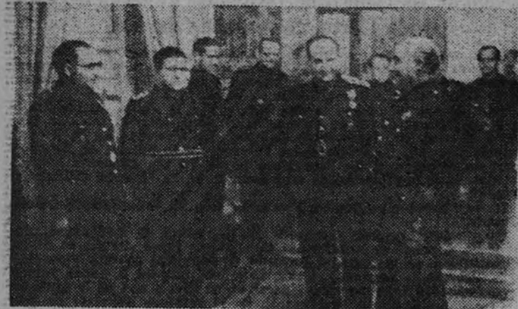
Su Excelencia el Jefe del Estado, acompañado del Ministro Secretario General, conversa con los Jefes Provinciales durante la recepción ofrecida en el palacio de El Pardo.