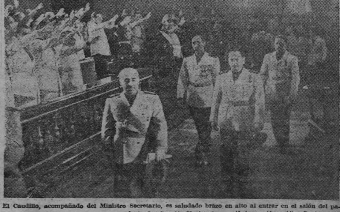
El Caudillo, acompañado del Ministro Secretario, es saludado brioso en alto al entrar en el salón del palacio del Consejo Nacional

Hoy llegará a San Sebastián la última expedición de la División Azul SAN SEBASTIAN.—Hoy llegará a esta ciudad la última expedición de voluntarios de la gloriosa División Azul que han luchado contra el comunismo en Rusia. La expedición se dislocará en esta ciudad. (Cifra.)