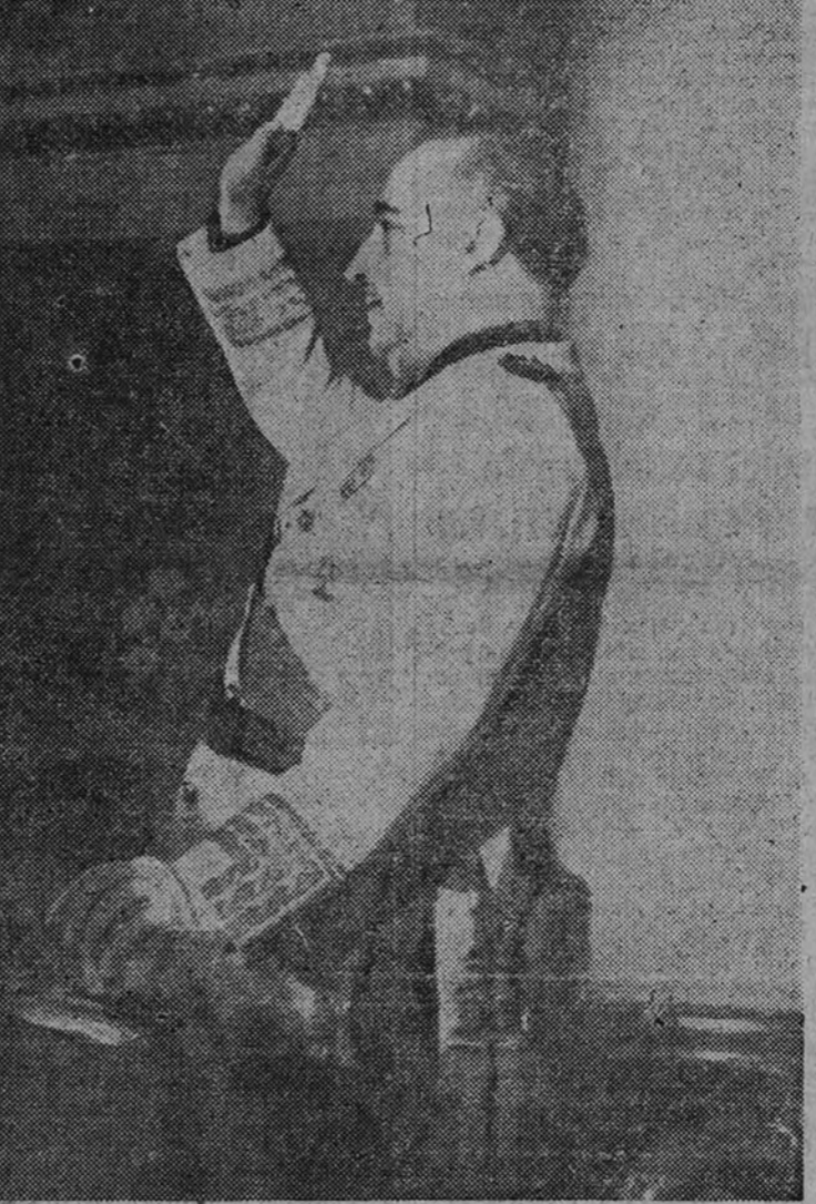
El Caudillo corresponde emocionado a las aclamaciones en el momento de serle ofrecida la Palma de Oro

Aquí, cerca, próximo a este lugar, en el Cuartel de la Montaña, quienes fueron los que murieron con nuestros generales, con nuestros jefes y con nuestros oficiales. Pues al con aquel régimen y en aquel sistema la Falange, representando al pueblo, fué la que acudió a los cuarteles, llevándoles la savia popular del Alzamiento, y el