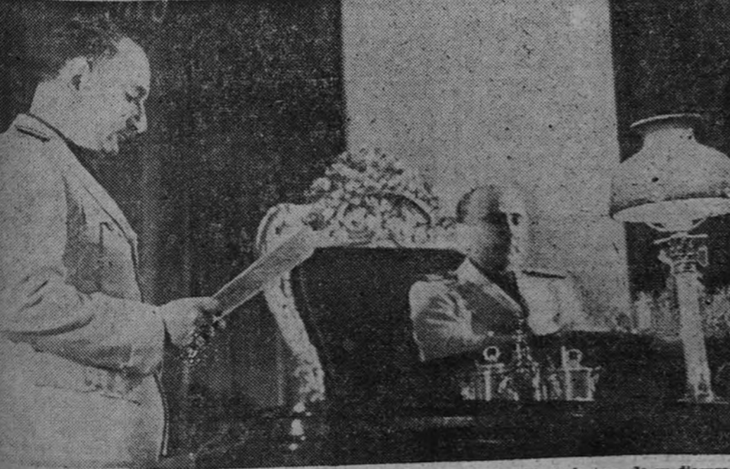
El Caudillo preside el trascendental acto. El Ministro Secretario General durante la lectura de su discurso