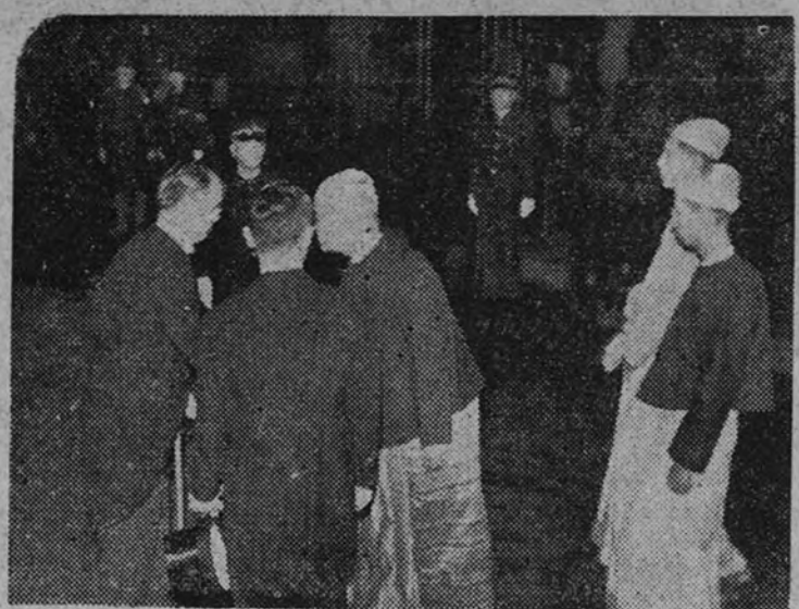
El doctor Thein Maung, embajador extraordinario de Birmania, a su llegada a Tokio es recibido por el ministro japonés de Asuntos Exteriores, Namuro Shigemitsu