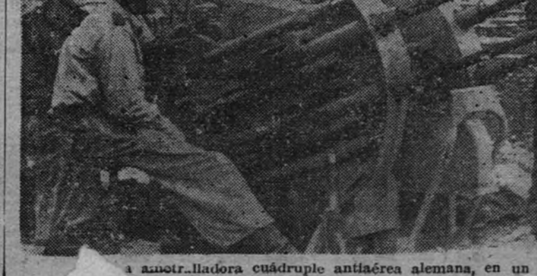
a ametralladora cuadruple antiaérea alemana, en un sector del frente italiano