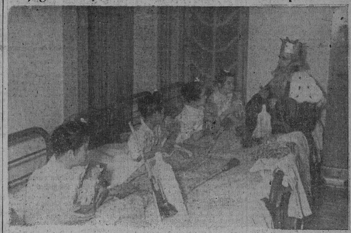
El Rey Mago dirige unas palabras a los pequeños acogidos a la Obra Nacional de Auxilio Social, que le escuchan con la mayor atención

A media noche, el comercio de la capital había vendido juguetería por valor de varios millones de pesetas