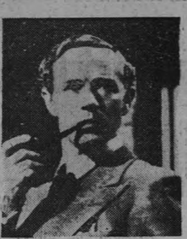
Leslie Howard en un fotograma de "Intermezzo", uno de sus mayores éxitos interpretativos

ESPAÑOL.—Hoy, jueves, a las 4 en punto: Pastoral de Navidad. Belén, por la compañía del Lope de Rueda. Éxito maravilloso. Último día.