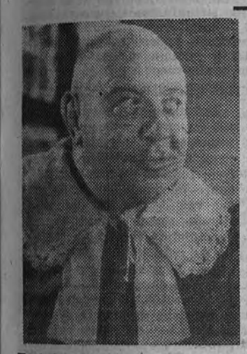
Emil Jannings en una de sus más recientes creaciones, el juez de paz de la famosa comedia de Enrique de Kleist, de principios del siglo pasado, «Der zerbrochene Krug». «El cántaro roto», y que ha sido llevada a la pantalla por la Tobis-Film.

Emil Jannings es un nombre familiar para los aficionados al séptimo arte: el cine. Por eso no descubrimos nada al decir que su fama es absolutamente universal. Sus interpretaciones han quedado en la memoria de todos los públicos como ejemplo de auténticas y definitivas creaciones. Jannings, reputado por mucho tiempo como el actor cinematográfico más grande de la que ha producido Europa, alemán cien por cien, aunque nació en Alemania, sino en Brooklyn (Nueva York), el 23 de julio de 1888, pues era hijo de alemán. Cuando apenas tenía un año se trasladó con su familia a Europa. Emil Jannings, además de ser uno de los más grandes actores, es probablemente el más antiguo que continúa en activo hoy. Recientemente ha terminado su último film: «El cántaro roto». Su biografía es sobradamente conocida; sin embargo, no cedemos a la tentación de dejar consignados algunos de los hechos más destacados de su vida.