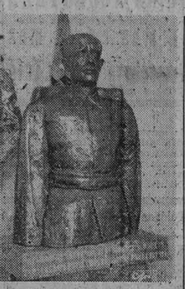
Busto en bronce del Ministro del Ejército, obra del escultor D. Juan Cristóbal, que los caballos mutilados dedican al general Asensio con motivo de la Pascua militar

A las once y media de la mañana visitará hoy el Ministro del Ejército, general Asensio, al teniente general señor Barreiro Castillo, que es el de más edad de su categoría, al que, en nombre de las nuevas generaciones castrenses, ofrecerá el homenaje a la veteranía. Esta forma de homenaje fué inaugurada el año pasado por el general Asensio, y por su gran acierto puede decirse que ha tomado ya carta de naturaleza. El Ministro irá acompañado del Capitán General y autoridades militares y una Comisión de jefes y oficiales del Cuerpo al que pertenece el veterano general, hoy en situación de reserva. Rendirá honores a la puerta de la casa del teniente general una compañía del