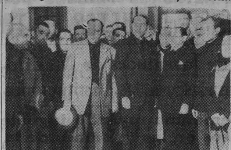
Se encuentra en Sevilla desde hace unos días el Delegado Nacional de Provincias, camarada Sancho Dávila. Ha visitado las Delegaciones de los distritos sevillanos. En la foto aparece con el jefe Provincial, camarada Coca de la Píñera, visitando la Delegación del distrito de Triana.