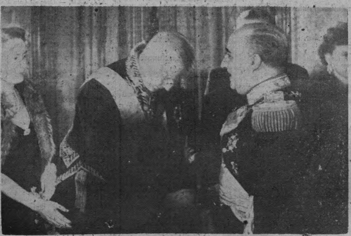
El Caudillo, en la recepción celebrada anoche en el Palacio de Oriente