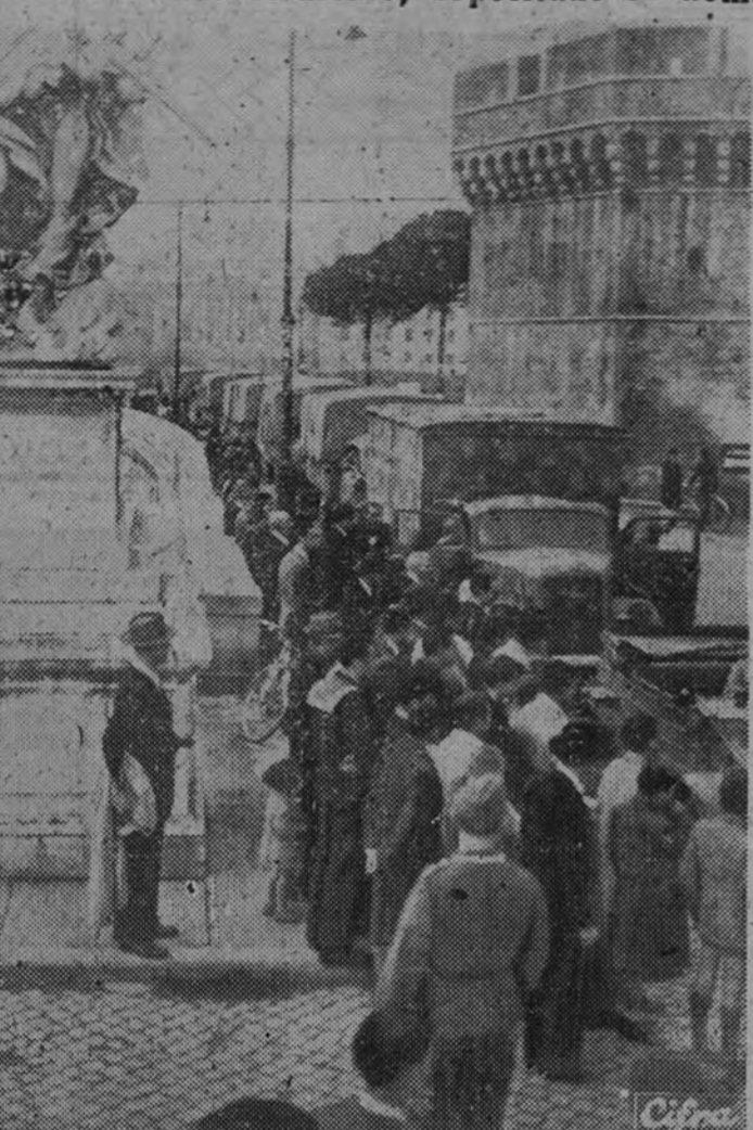
La famosa biblioteca del monasterio benedictino de Montecassino ha sido transportada a Roma para que, al abrigo de la ciudad declarada libre, no sufra los devastadores efectos de la guerra. La foto nos muestra el momento de la llegada a la Ciudad Eterna de los doce camiones que contienen 20.000 volúmenes y un millar de manuscritos. Provisionalmente ha sido instalada esta biblioteca en el Castej de S. Angelo, hasta que sea transportada, con autorización de la Santa Sede, al Vaticano.