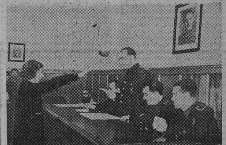
El Vicesecretario de Educación Popular entrega los diplomas a los nuevos periodistas. Una camarada que ha obtenido el título presta juramento.