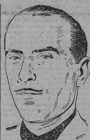
Rodríguez de Valcarlos

Muchos de los que aquí estáis tenéis en vuestro haber de felicitad la participación en las tres grandes acciones libradas por la Falange: la guerra sin cuartel de las encrucijadas, las batallas de nuestra Cruzada y los combates mentales frente a un enemigo insospechadamente fuerte en la misa más profunda de la tierra; he'lla la guerra sin cuartel, el rigor y gozo en es de cumplida firmeza. Este estilo inconformista, heroico, como a guerras, organización para la vida, en la honra, marca de una manera indelible la acción de nuestro Sindicato. Pero en tantos los que en estos diez años han