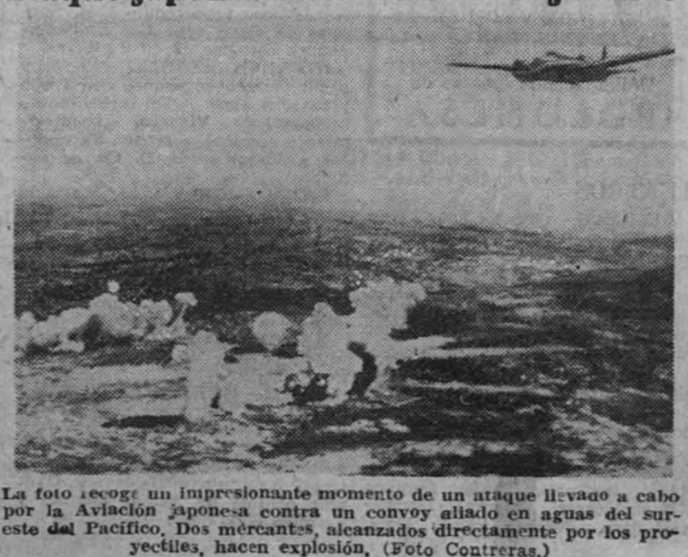
La foto recoge un impresionante momento de un ataque llevado a cabo por la Aviación japonesa contra un convoy aliado en aguas del suroeste del Pacífico. Dos mercantes, alcanzados directamente por los proyectiles, hacen explosión.

La salutación del Caudillo a los jefes del Ejército, recogida por la Prensa norteamericana