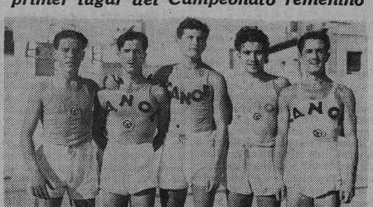
El equipo del Cano de la Obra Sindical Educación y Descanso, que sigue a la cabeza de la clasificación en segunda categoría

Primera categoría. Puntuación.—1. América, 14 puntos; 2. Real Madrid, 13; 3. S. E. U., 12; 4. Colegio Alamán, 12; 5. E. D., de Guadalajara, 10; 6. Imperio F. de J. de Segovia, 10; 7. I. N. Previsión, 8; 8. Hospital de E. D., 8; y 9. Ateneo E. y D., 6.