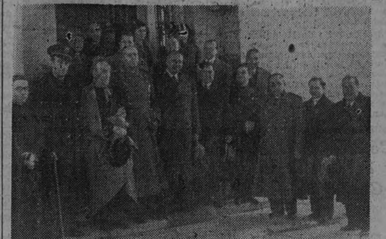
El Ministro de Justicia, señor Aunós, con las autoridades civiles y militares y jerarquías del Movimiento, en la inauguración del Sanatorio antituberculoso de Mujeres, en Segovia.

Palabras del camarada Aunós en el acto celebrado en su honor