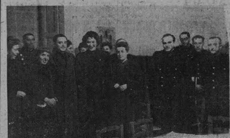
Jerarquías del Movimiento en el acto de la inauguración

ENTREGA DE PREMIOS POR EL "DÍA DE LA MADRE"