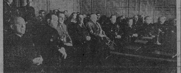
El Ministro de la Gobernación, con otras personalidades, en la presidencia del acto celebrado el domingo en el teatro Colisevm.

Entre los asistentes figuraban numerosos médicos, farmacéuticos y demás personal sanitario, personalidades del Derecho y empresarios, técnicos y obreros. La presencia del camarada José Antonio Giron fué acogida con una gran ovación.