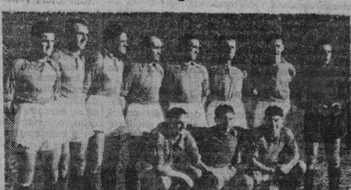
El equipo del Oviedo, que resultó más completo de lo que nos habían anunciado

No hay cosa peor para un equipo que la confianza excesiva en la victoria. Pero a veces, así sucede el caso del domingo; tampoco resulta muy conveniente sentirse demasiado pavor a la posibilidad de la derrota. El domingo sobre el subconsciente de este equipo de perder termina por dejarse a guisa de un "cock-tail" la preocupación de las tácticas defensivas, para precisamente, a crear un fútbol real. Así no ha surgido el hombre que en fútbol pueda duplicar los papeles, y en la W y en la M hay quien tiene que doblar los. Viene el pelo esta circunstancia para dar la máxima actualidad a nuestro artículo del otro día sobre el tema. Las tácticas defensivas terminan por dejar estereotipada la virilidad del buen fútbol, que debe anteponer su agresividad, su libre juego de ataque, al sistema de retroceder de líneas y de jugadores en la negación de una defensa reforzada que a veces no cede. El público avianista salía el domingo del Estadio trinando contra las tácticas defensivas. Con