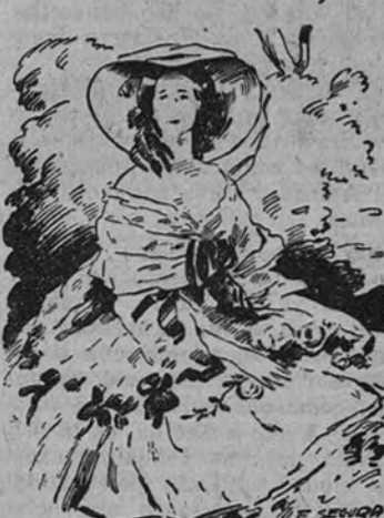
Eugenia de Montijo

El estreno de «Suez», con la apostilla que, en forma de nota publicada en todos los periódicos, publicada en la Real Academia de la Historia, remachó una vez más el clavo de una vieja verdad: aquella que nos dice que los hombres y las mujeres españoles que marcaron una ruta en la Historia sólo deben ser tratados cinematográficamente por mentes españolas. De nuestra capacitación para tales menesteres nos hablan los recientes éxitos del cine nacional; la necesidad de que nuestras biografías salgan de nuestras propias manos, la marca el hecho cierto de que muy pocas veces alcanzaron, cuando fueron tratadas por el extranjero, la fidelidad histórica espiritual que las hizo famosas. Mucho se había hablado en los corrillos cinematográficos de la Empresa de llevar a la pantalla la vida novelesca por sencilla, de Eugenia de Montijo. El tema montijano apasionó durante mucho tiempo a nuestros escritores cinematográficos, llegando a escribir, no una, sino varias historias entresacadas de la historia misma de nuestra Emperatriz. Dificultades de uno u otro orden impidieron convertir en realidad aquellos primitivos proyectos, y cuando ya se habían pacificado las aguas remojadas de los comentarios ha surgido de nuevo el tema montijano, esta vez en forma de afirmación concreta. Recibimos la noticia de labios de don Enrique Rodiño, periodista, es-