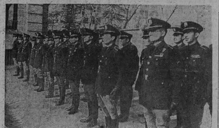
Los congresistas, formados ante las jerarquías nacionales

des, cerca de la juventud productora. Terminó diciendo: "Es preciso que enseñéis a aquellos cuya formación os está encomendada a interpretar y valorar vuestras leyes sociales, porque con ellas se mantiene uno de los pilares fundamentales que el Caudillo 'en la para nuestro Estado: la Justicia Social.' 'Arriba España'".