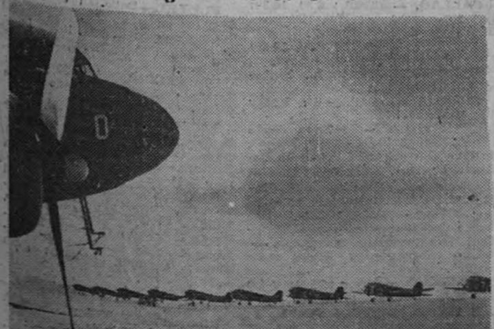
En un aeródromo británico del Oriente Medio, estos grandes aviones de transporte aliados están preparados para enviar mercancías a los distintos lugares donde combaten las fuerzas aliadas