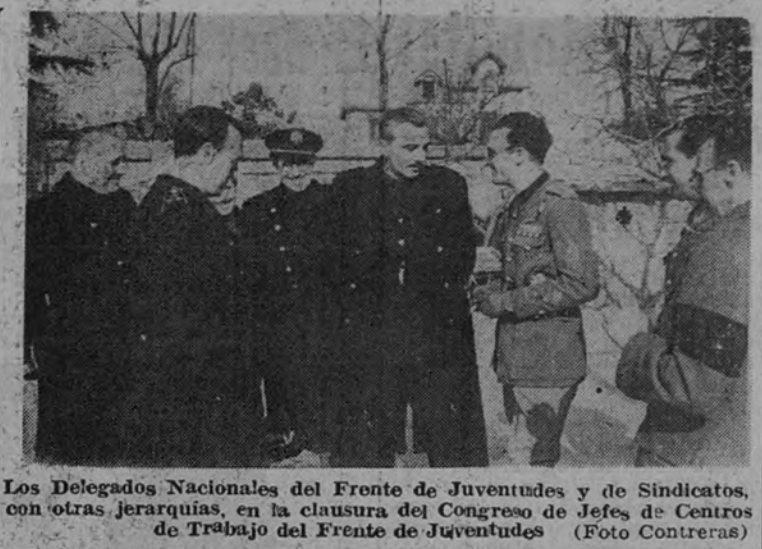
Los Delegados Nacionales del Frente de Juventudes y de Sindicatos, con otras jerarquías, en la clausura del Consejo de Jefes de Centros de Trabajo del Frente de Juventudes

Ofreció a continuación la colaboración del Ministerio a través de sus Delegaciones Territoriales de fuerza, pero en el intento de invasión se verá obligado a emplearlas todas. Es de suponer que desde el