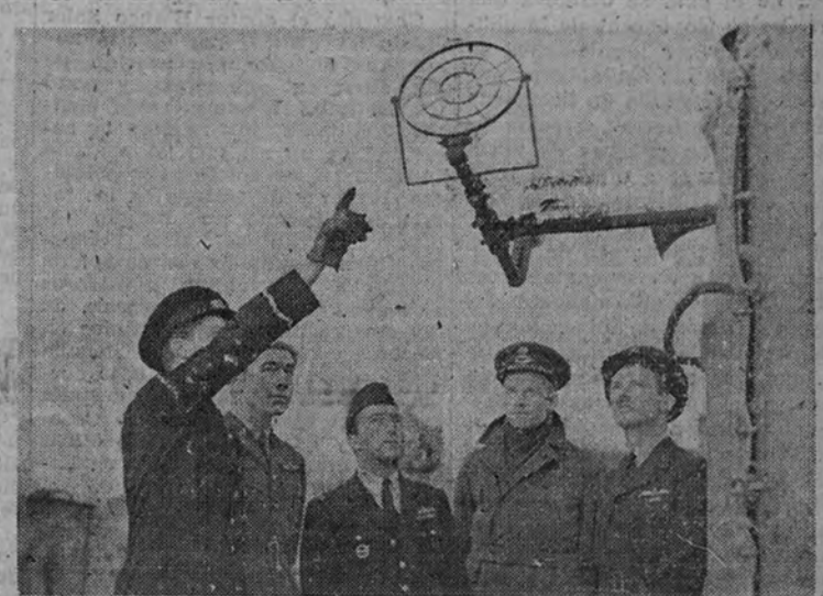
Cuatro aviadores ingleses escuchan las explicaciones que les da un oficial de la Marina sobre un cañón antiaéreo.