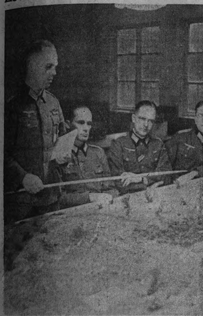
Oficiales alemanes en la Escuela de Armas recibiendo lecciones en táctica de arena, donde se señala la diaria situación de las operaciones.