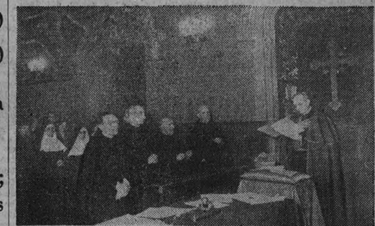
El obispo de Madrid-Alcalá, en la lectura de su discurso.