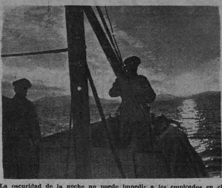
La oscuridad de la noche no puede impedir a los empleados en el cumplimiento del servicio. La guardia responsable vigila la superficie del agua.