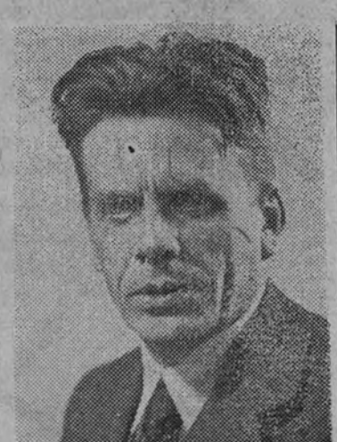
El maestro Toldrá

Eduardo Toldrá es el tipo del músico nato, del artista que siente, que se comprometa con la idea de cada obra, que se cuida del detalle, de la expresión, del ritmo. Su manera de dirigir, su peculiar