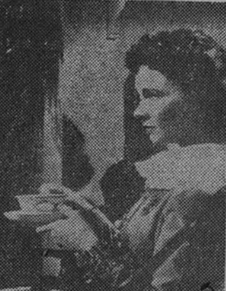
Vivien Leigh en "Lady Hamilton", éxito en segunda semana del cine Progreso.

Director JACK CONWAY William POWELL Myrna LOY Mi marido está loco GAIL PATRICK · JACK CARSON (188 P)