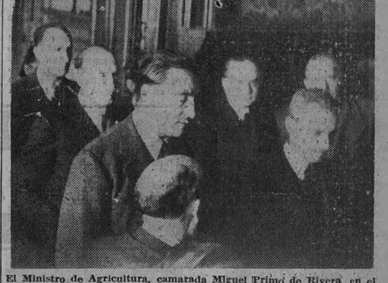
El Ministro de Agricultura, camarada Miguel Primo de Rivera, en el acto de dar posesión de su cargo al nuevo director general de Montes