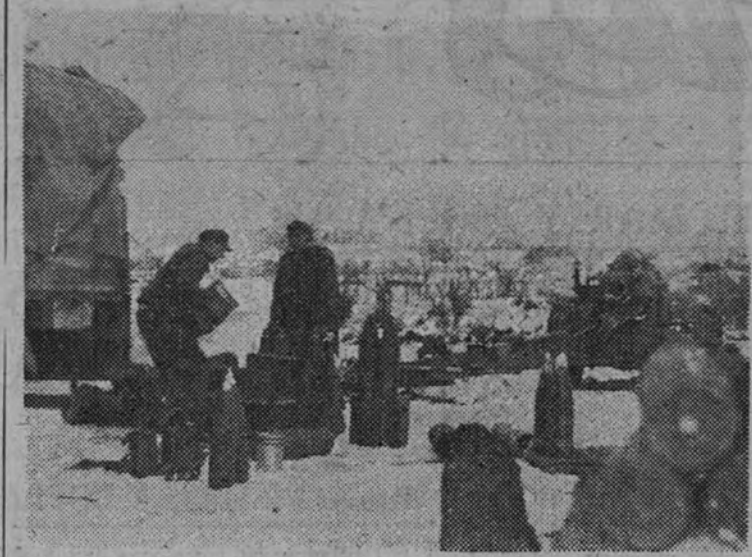
Unidades de aviones de combate y artillería pesada apoyan a los infantes en su dura lucha. Incansablemente envían las piezas su carga mortífera a las concentraciones enemigas, facilitando la lucha de los granaderos. Hasta las piezas han llegado el camión cargado de granadas, las cuales son descargadas.