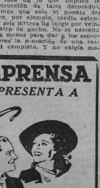
La admirable pareja Jeanette MacDonald-Nelson Eddy reaparece mañana en el Palacio de la Prensa con "Ciudad del Oro".

"LA REINA DEL SUR" ES UNA SERIE DE DECORADOS Una parte de las divertidas aventuras que suceden a los protagonistas de la deliciosa comedia Paramount "Las tres noches de Eva" tiene por escenario el lujoso trasatlántico "La Reina del Sur", que sirve la línea Nueva York-Buenos Aires. Se trata de un verdadero palacio flotante que hubo necesidad de reproducir en los estudios con sus salones de baile, comedores, piscinas, salones de fumar, gimnasios, etc. Para dar idea de lo que implicó la construcción de tales decorados, diremos que solo el puente del barco, por ejemplo, media setenta y seis metros de largo por veinticuatro de ancho. No se necesita nada menos para dar a los espectadores la sensación de una realidad completa. Y no exigía me-