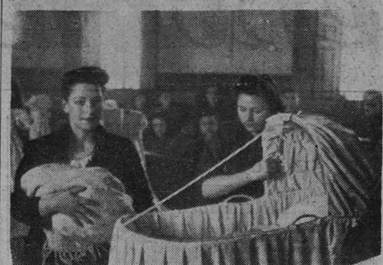
Entrega de las magníficas cunas.

Distribución en el Puente de Vallecas de canastillas y cunas confeccionadas por la Sección Femenina