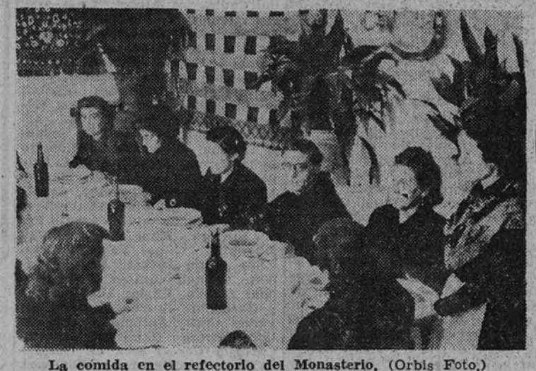
La comida en el refectorio del Monasterio.