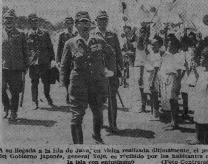
A su llegada a la isla de Java, en visita realizada últimamente, el jefe del Gobierno japonés, general Tojo, es recibido por los habitantes de la isla con entusiasmo

Esta tarde, a las siete, en el Aula de Cultura (antiguo Ateneo) pronunciará su anunciada conferencia en lengua castellana sobre el tema "Oliveira Salazar, íntimo", el ilustre periodista portugués Antonio Ferro. Hará la presentación, como ya se ha anunciado, el director del Instituto Español en Lisboa, académico de la Española y colaborador de ARRI, BA, Eugenio Montes.