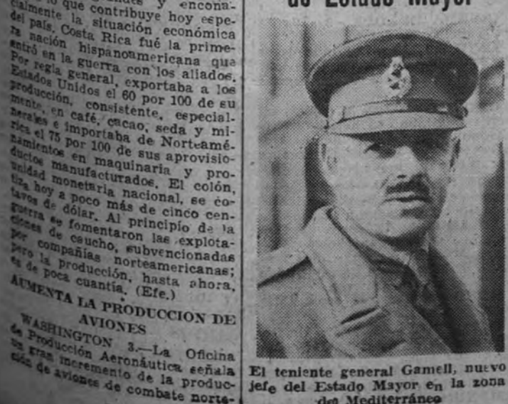
El teniente general Gamell, nuevo jefe del Estado Mayor en la zona del Mediterráneo