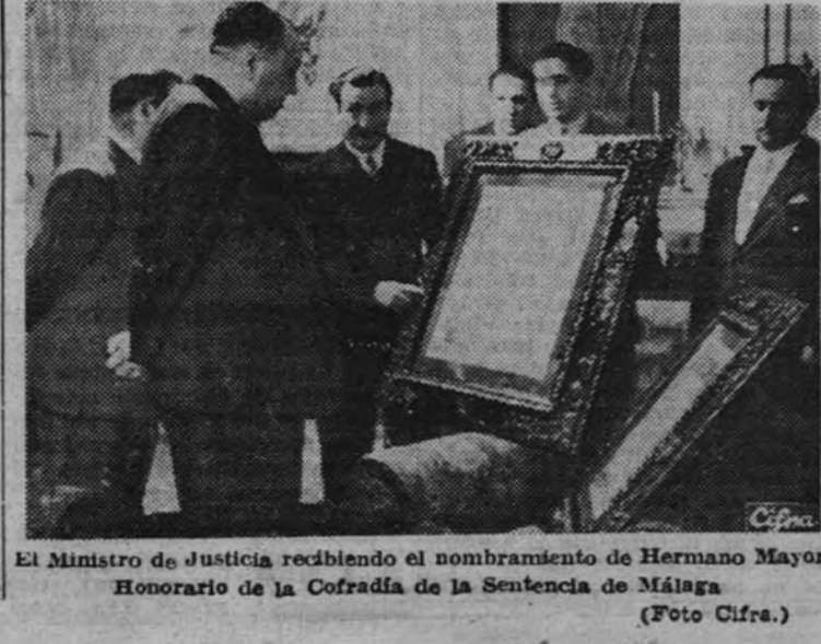
El Ministro de Justicia recibiendo el nombramiento de Hermano Mayor Honorario de la Cofradía de la Sentencia de Málaga