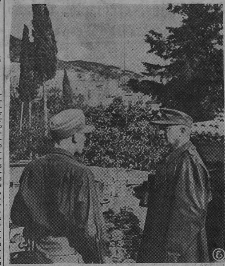
Un general alemán da instrucciones a uno de sus oficiales para las inmediatas operaciones de ofensiva contra los anglosajones en las inmediaciones de la Via Apia, que los invasores pretenden a todo trance alcanzar