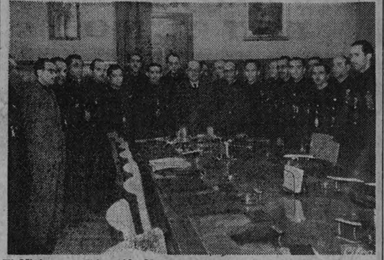
El Ministro de Educación Nacional preside el pleno de la Junta Consultiva del Servicio Español del Magisterio

LA JUNTA ROGO AL MINISTRO TRANSMITIERA AL CAUDILLO LA FERVOROSA ADHESION DE LOS MAESTROS