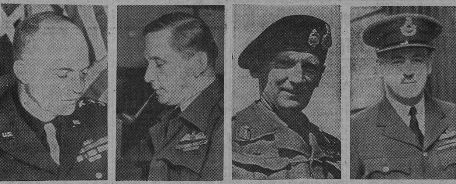
Eisenhower, generalísimo; Tedder, segundo jefe; Montgomery, comandante jefe de las fuerzas británicas del segundo frente, y Mallory, jefe de las fuerzas aéreas aliadas

Los norteamericanos Eisenhower y Tedder ocuparán los cargos de generalísimo y segundo jefe, y los ingleses Montgomery, Mallory y Ramsay mandarán las tropas británicas y las fuerzas aéreas y navales, respectivamente