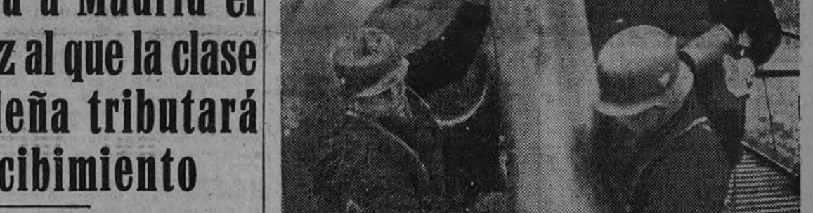
Artillería alemana en el Este

Con el desembarco cerca de Anzio y Nettuno, en el que los angloamericanos han empleado varias divisiones, el Mando aliado ha tratado evidentemente de repetir (Continúa en última página)