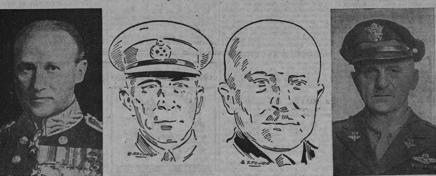
Ramsay, comandante jefe de las fuerzas aliadas navales; Franklin, jefe de las fuerzas metropolitanas; Burkel, jefe del Ejército belga en Inglaterra, y Spaatz, comandante de las fuerzas de bombardeos estratégicos contra Alemania