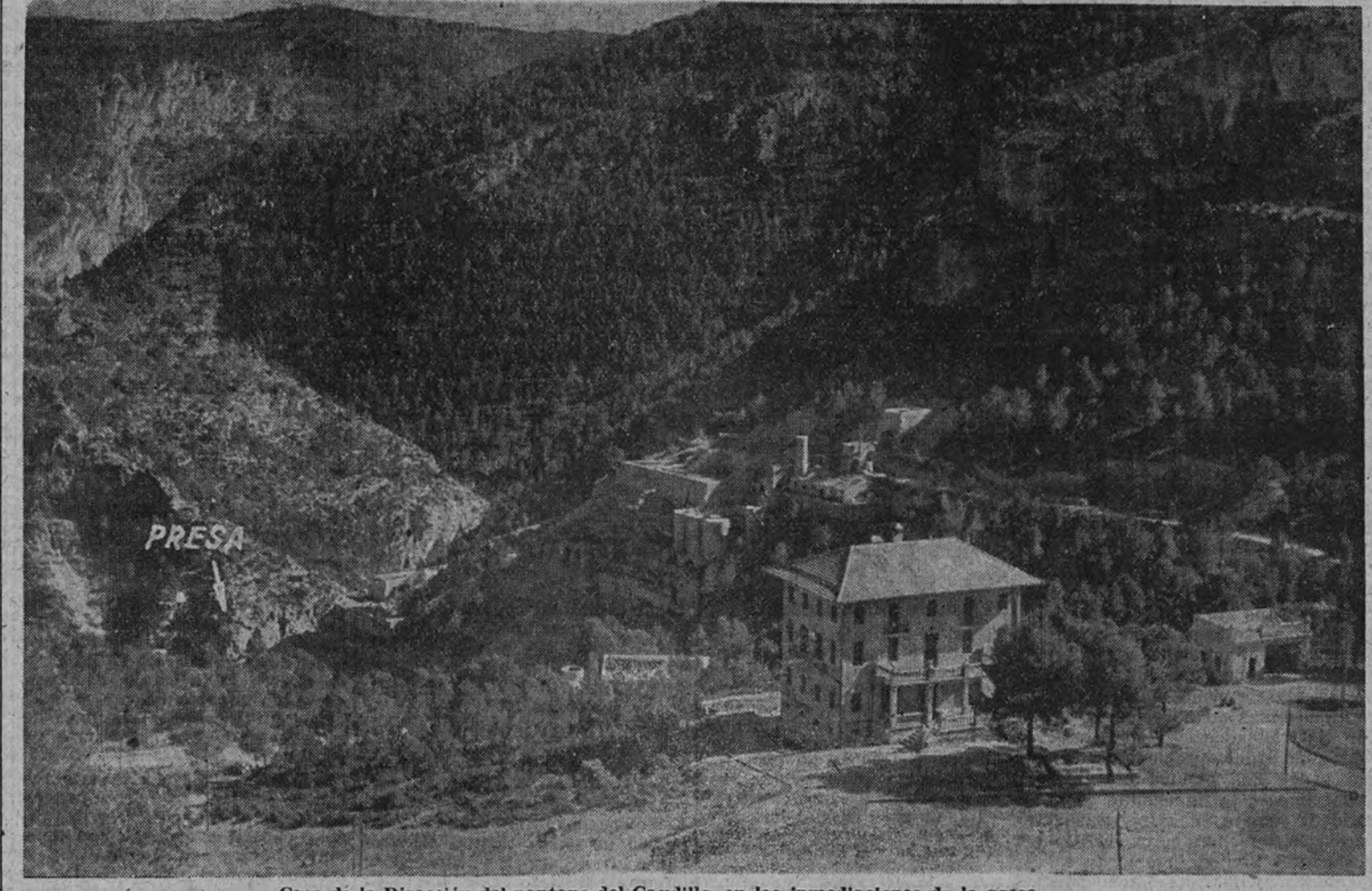
Casa de la Dirección del pantano del Caudillo, en las inmediaciones de la presa

Necesidad de este pantano El pantano del Generalísimo, en el río Turia, es una de las obras más importantes de España. Desde hace mucho tiempo se había sentido la necesidad en la parte de la huerta valenciana regada por las aguas del Turia, de un pantano regulador, que acumulando los recursos hidráulicos de este río durante el otoño y el invierno, permitiera así el gran problema del agua en las tierras que riegan las acequias de la vega de Valencia y sus pueblos vecinos. Este problema era en estos últimos tiempos más grave y agudo a causa de perturbaciones en los últimos años. Además, al aumentar los terrenos regados, que la laboriosidad y afán constante del labrador valenciano ha rescatado al secano para su mejor aprovechamiento. Concretamente la necesidad sentida en la construcción de un pantano, se comentaron los trabajos preparatorios, proyectos, presupuestos, pro-