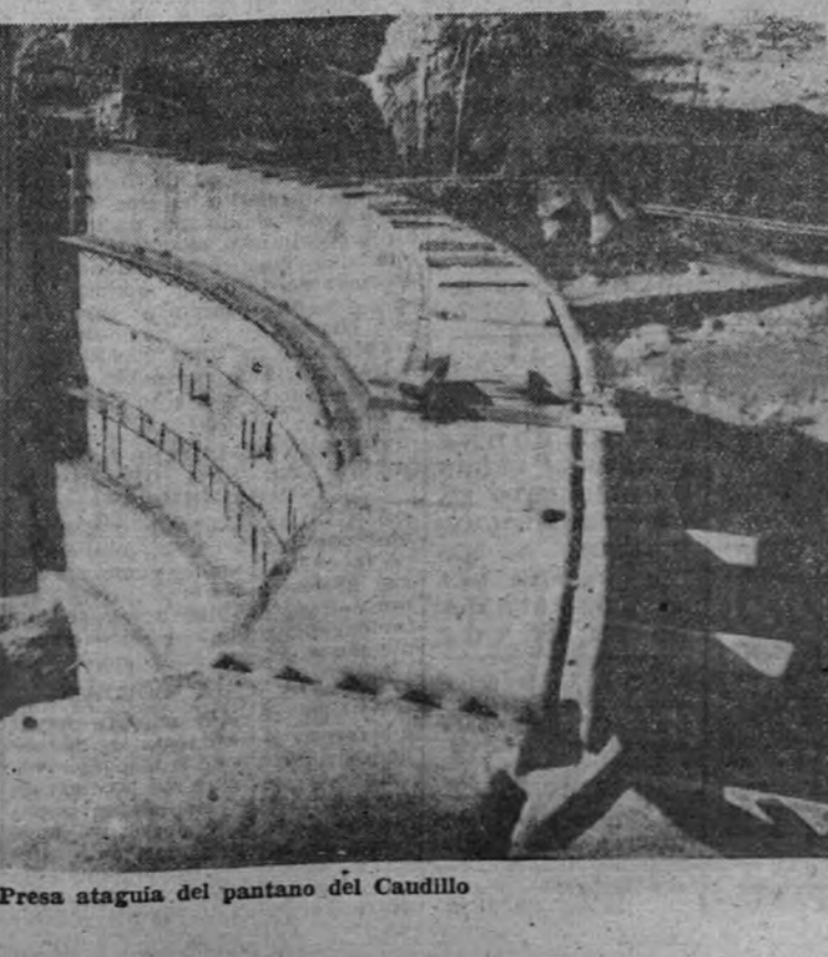
Presa ataguía del pantano del Caudillo

15.500 hectáreas de riego durante el estiaje La construcción del pantano asegurará durante el estiaje el riego de toda la huerta actual de la provincia de Valencia, abarcando un total de 15.500 hectáreas. Las muy conocidas siete acequias de la vega de Valencia y las de los pueblos castillos, recogen sus aguas del río Turia. Entre estas acequias figura la de Moncada, que se extiende en una longitud de cerca de treinta kilómetros desde que nace del Turia hasta Puzol, atraviesan-