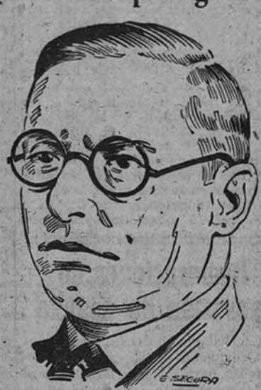
D. Francisco Vieira Machado

El doctor Vieira Machado, presidente del Consejo del Imperio Colonial portugués