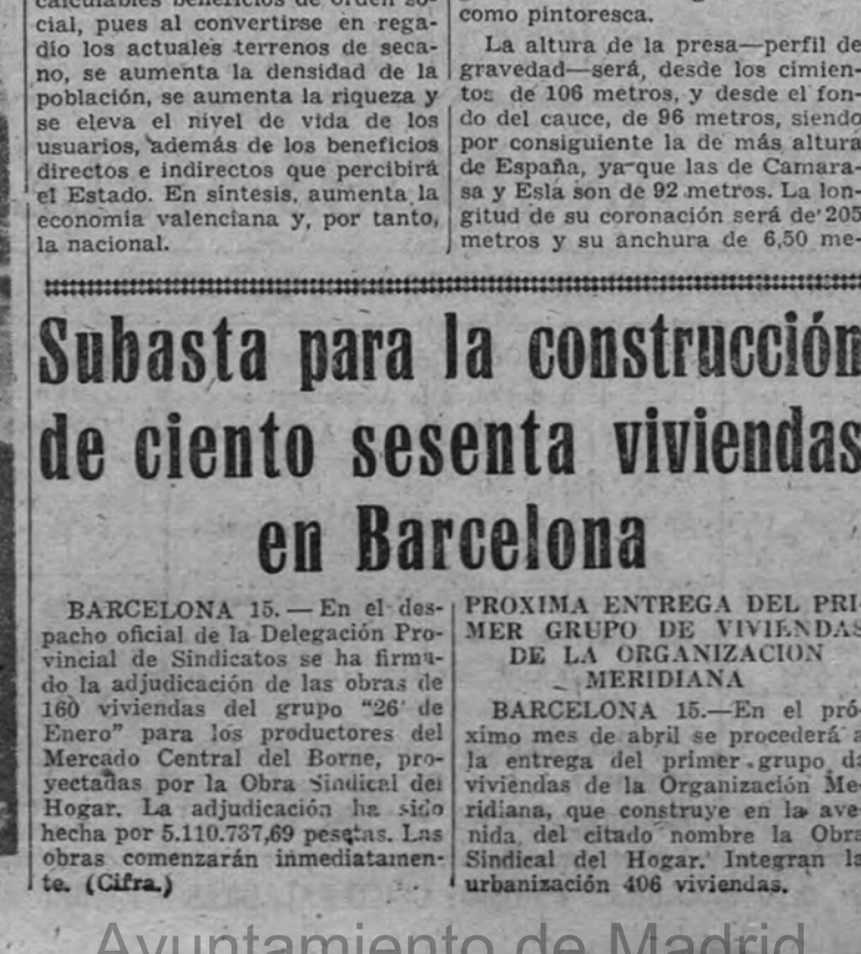
Subasta para la construcción de ciento sesenta viviendas en Barcelona

También se crearán importantes fuentes de energía eléctrica. Nuevas fuentes de energía eléctrica. Construcción de cinco saltos También se crearán importantes