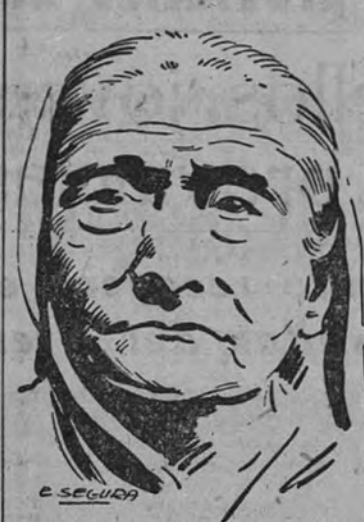
LONDRES 22. — La radio de Nueva Delhi anuncia que ha muerto la esposa del mahatma Gandhi. (Efe.)

Se hallaba detenida en compañía del "mahatma"