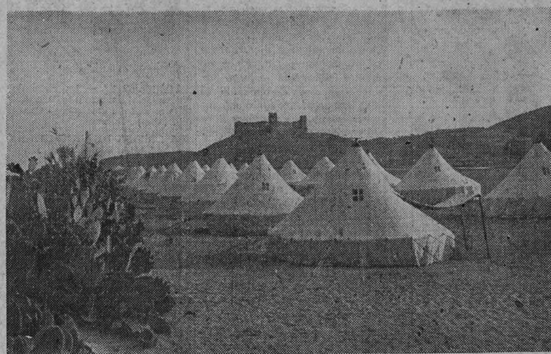
Vista general del Campamento "Alcázar de Toledo"

comocimientos, al mismo tiempo que fortalecían su capacidad física con una ordenada y metódica práctica de deportes. Hubo, sin embargo, otros camaradas del Frente de España, A. I. de Valencia, situado cerca de Alforache, asisten camaradas de Aragón, Cataluña, Levante y Baleares, y a. I. de Málaga, en Torremolinos, camaradas de Andalucía y Extremadura. El Campamento de Valencia se ha instalado en un edificio anteriormente dedicado a Estación Preventorial, y el de Málaga, en un Albergue de la Sección Femenina.