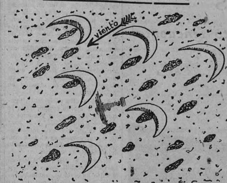
Campo de barichanes en la zona de las verdaderas "graras". El punteado es la vegetación menor dispersa. (Dibujo del autor, E. Guinea, tomado desde el avión)

Amoroso el día, que nos brinda una fuerte emoción en persona. Hoy debemos volar del desierto. Vemos a Villa Cisneros desde el aire. Después de la visión analítica y objetiva de la vida humana que hemos vivido estos días de las sebjas, volamos en general, etc., etc. La fortuna nos ofrece la visión aérea, sobrehumana, del Sahara (en árabe, desierto). Los primeros ojos de hombre al servicio de una pura conciencia geográfica se van a deslizar hoy, a la vez que materialmente la vista, a la vez que esta anti-guerra y vieja de esta anti-guerra zona de la tierra.